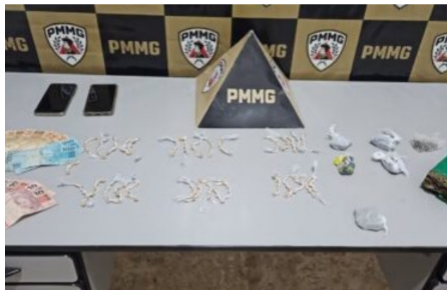
Droga apreendida pela PM

Os envolvidos receberam atendimento médico e, posteriormente, foram encami-