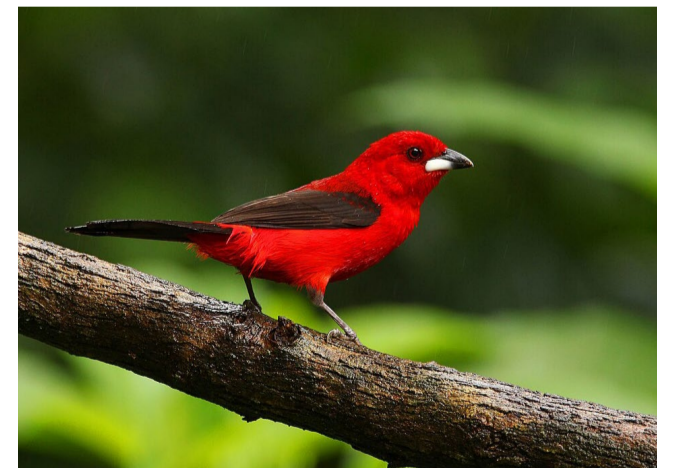
O pássaro o tiê-sangue ( Ramphocelus bresilia ) já foi preponderante no Vale do Rio Piranga, inclusive no Parque Natural Municipal Tancredo Neves, no Passa-Cinco, mas anda sumido na região.

Para participar, basta acessar a plataforma digital do IEF e verificar a lista prévia de espécies candidatas para avaliação.