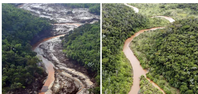
Recursos liberados pelo Fundo Rio Doce ajudam na recuperação dos rios da Bacia do Rio Doce

A iniciativa prevê a implantação de sistemas agroflorestais, recuperação de áreas degradadas e construção de barraginhas para armazenamento de água da chuva e contenção da erosão. A previsão é atender 4.650 unidades produtivas rurais e implantar 1,4 mil hectares de florestas produtivas.