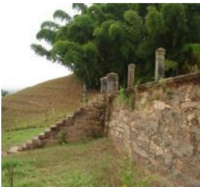
1 Cemitério dos Escravos está abandonado, semidestruído e inacessível

No encontro realizado para a entrega do documento, o editor do Líder Notícias , jornalista Ricardo Motta , que liderou a campanha para a desapropriação do Cemitério dos Escravos disse que o momento histórico resgatava uma dívida de Ponte Nova com a raça negra, que foi estigmatizada pela escravatura e o racismo do passado e ainda estrutural nos tempos atuais.