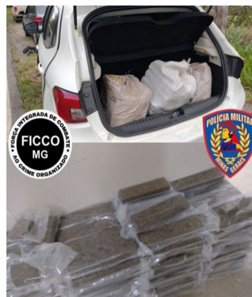
● Droga apreendida em 18 de novembro de 2025, em Pouso Alegre

- Mulher é presa e adolescente é apreendido com 152 tabletes de maconha em porta-malas de carro. Segundo as investigações, o plano era levar a droga até Juiz de Fora. A prisão ocorreu na cidade de Pouso Alegre, no Sul de Minas Gerais, durante uma operação conjunta da Força Integrada de Combate ao Crime Organizado de Minas Gerais (FICCO/MG) e a Polícia Militar Rodoviária, no dia 18 de novembro do ano passado (2025).