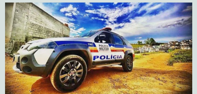
📹 Portal Caparaó registrou a viatura da Polícia Militar indo para resolver o problema

Durante rastreamento, os policiais militares descobriram que a mulher estava em uma residência no bairro próximo à casa do idoso. Conforme o registro policial, ela apresentava manchas aparentes de sangue na roupa e cortes no braço compatíveis com a quebra da janela usada para acessar a casa da vítima. Durante busca pessoal foram encontradas 04 (quatro) pedras de crack com a suspeita.