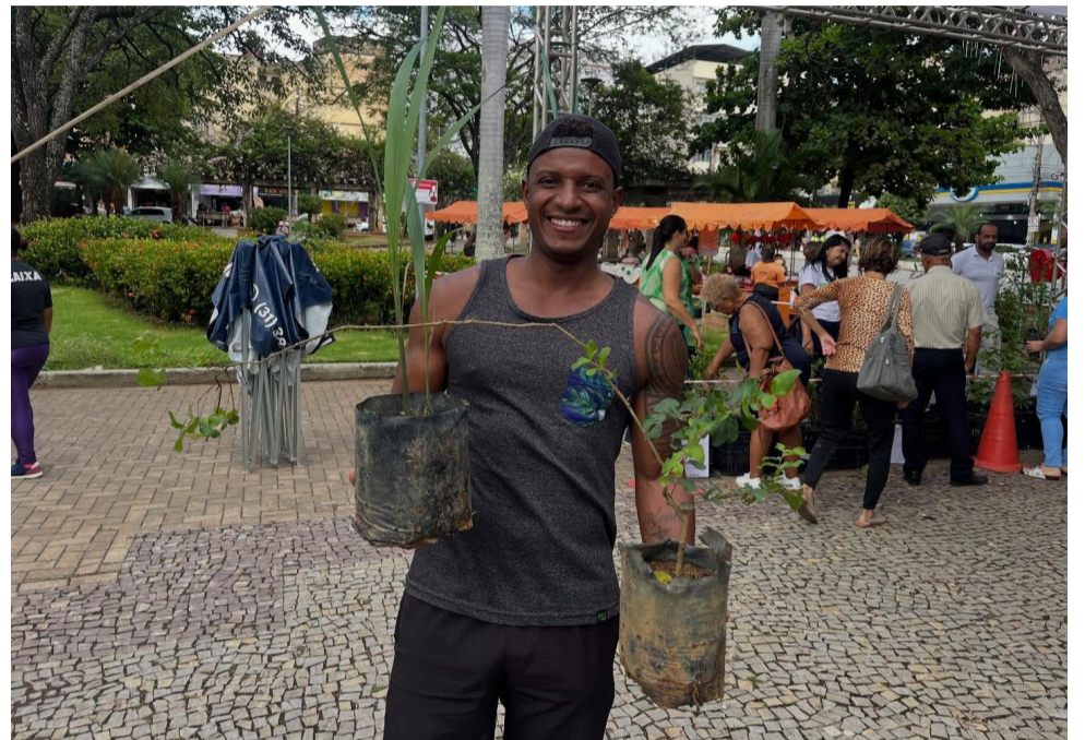
Semam distribuindo mudas de árvores nativas em 22 de março de 2026