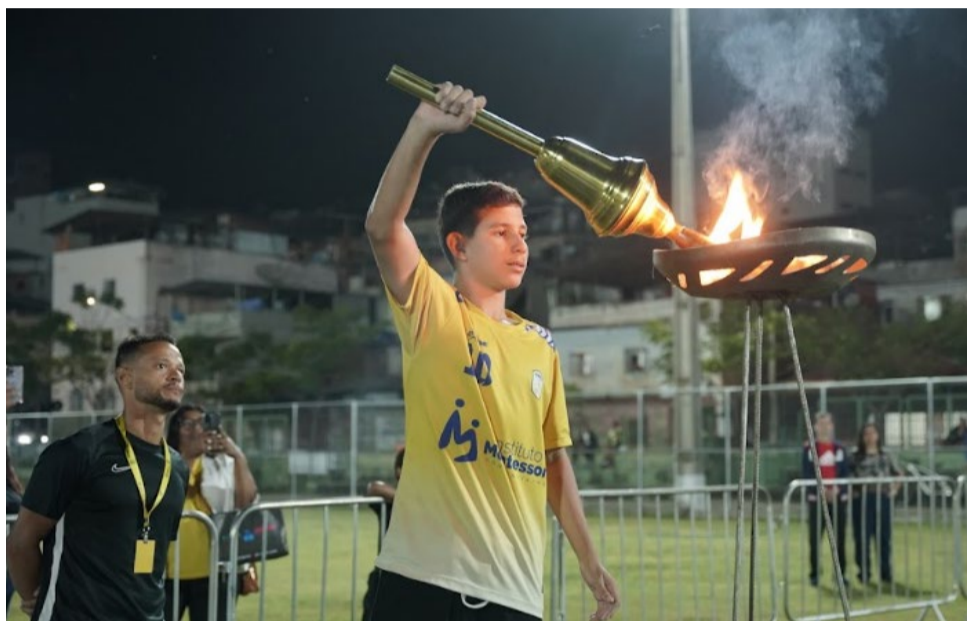
O atleta estudante do Instituto Montessori conduziu a tocha olímpica que acendeu a pira

O pontapé inicial oficial da etapa microrregional dos Jogos Escolares de Minas Gerais (Jemg) aconteceu no início da noite na segunda-feira dessa semana, 25 de maio de 2026, em uma grande ce-