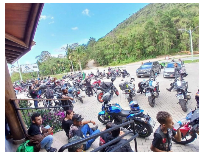
Em 2025, o Encontro Nacional de Motociclistas reuniu mais de 200 amantes da direção nas duas rodas.

A programação musical começa na sexta-feira, com apresentações da Banda O Verbo, às 18 horas, Banda 3 Graus, às 20 horas, e da banda Máscara, às 22h30min. No sábado (30/05), o evento