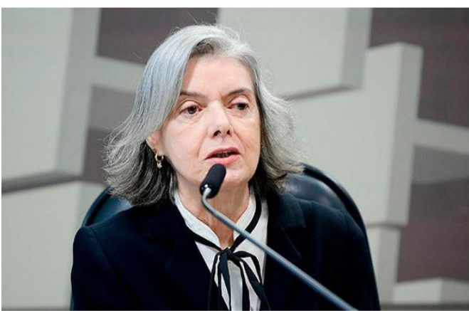
Conselho Universitário aprova concessão de título à ministra Cármen Lúcia.

Atual ministra do STF , tendo sido presidenta da suprema corte e do Conselho Nacional de