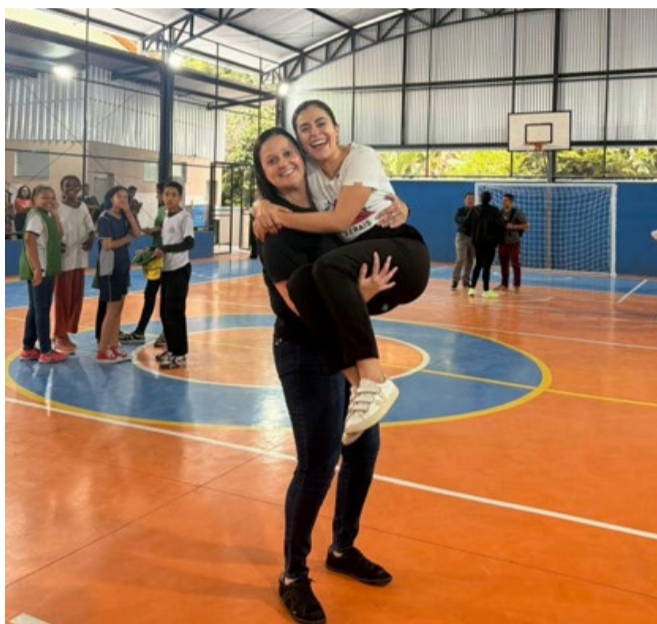
Na quadra da Escola Estadual Coronel Cantídio Drumond Suellen Fisioterapeuta (PV), num gesto de carinho e agradecimento, pegou a deputada estadual Lohanna (PV) no colo

Uma emenda no valor de R$300 mil, destinada peça deputada Lohanna (PV), para reforma e cobertura da quadra da escola, reforma de salas, biblioteca e depósito de esportes. Outra entrega da vereadora é a alocação de R$200 mil para implementação de salas multissensoriais que serão implementadas nas escolas municipais Reinaldo