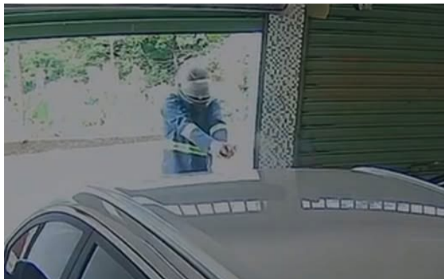
📹 Câmera interna de videomonitoramento, instalada na garagem do homem assassinado, registrou o momento do crime

As equipes policiais apuraram que o suspeito chegou e fugiu em uma motocicleta baixa, de cor escura e com rodas de liga leve vermelhas. As características do veículo foram identificadas por meio de imagens de câmeras de monitoramento próximas ao imóvel e também pela câmera interna da residência, que registrou a ação criminosa.