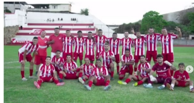
O Pontonovense F.C é tetracampeão da Supercopa dos Inconfidentes e Vale do Piranga: 2015, 2019, 2024 e 2025.

A Supercopa dos Inconfidentes e Vale do Piranga é um dos principais torneios de futebol amador do interior de Minas Gerais, criado em 2015. A competição promove a integração esportiva entre equipes de diferentes regiões, unindo os times das ligas de cidades das regiões dos Inconfidentes e Vale do Rio Piranga. Entre elas: Ponte Nova, Mariana, Ouro Preto, Viçosa, Alvinópolis e Urucânia.