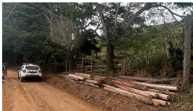
📹 Militares recuperaram as peças de eucalipto furtadas

Os policiais militares identificaram e fiscalizaram o caminhão utilizado no transporte das madeiras, que estava regular: O proprietário afirmou não saber que o caminhão havia sido usado para transportar material de origem ilícita. Por