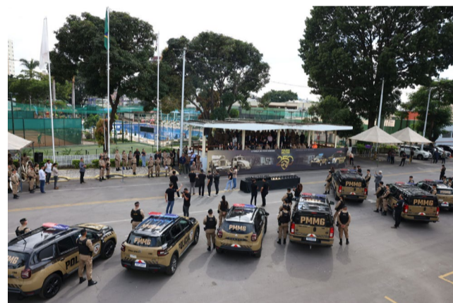
📹 Câmera interna de videomonitoramento, instalada na garagem do homem assassinado, registrou o momento do crime

Os armamentos, entre fuzis, pistolas e espingardas, serão destinados, também