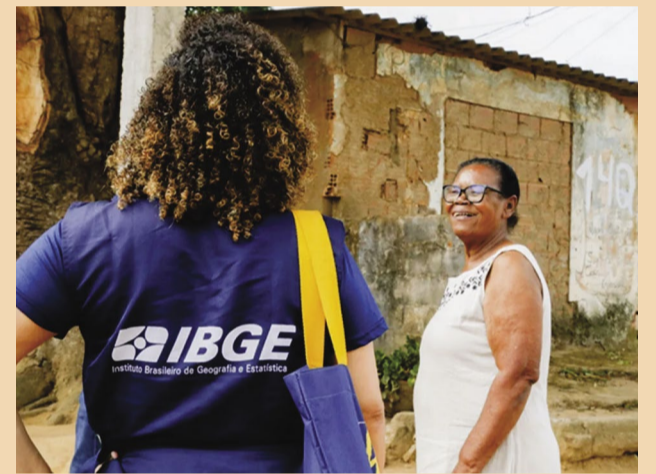
1 Brasil e o IBGE por meio do Censo Demográfico

O órgão oferece uma visão completa e atual do Brasil através do desempenho de suas principais funções: produção e análise de informações estatísticas; coordenação e consolidação das informações estatísticas; produção e análise de informações geográficas; coordenação e consolidação das informações geográficas e informações do País, que atendem às necessidades dos mais diversos segmentos ambientais.