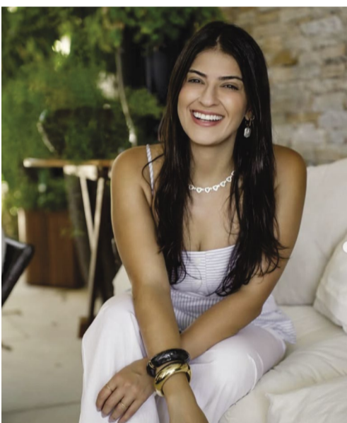
@paulacarvalhom – A lei não pode superar os direitos da pessoa!

1993: Sudão. Enquanto o mundo discutia política, guerras e diplomacia, uma criança africana tentava chegar até um centro de ajuda humanitária. Atrás dela, um abutre esperava. O fotógrafo sul-africano Kevin Carter registrou a cena que se tornaria uma das imagens mais brutais da história moderna. Meses depois, Kevin Carter ganhou o Prêmio Pulitzer. “Estou assombrado pelas lembranças de mortes, cadáveres, fome e crianças feridas” , disse Kevin Carter. Pouco tempo depois tirou a própria vida, aos 33 anos.