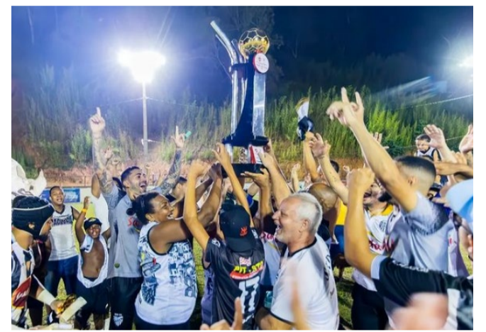
A S.E 1º de Maio derrotou o Pontonovense F.C e conquistou a Copa Ponte Nova, em 2023

A outra semifinal será entre o E.C Riodesense, equipe do município de Rio Doce, e o Nacional F.C, de Antônio Pereira, distrito de Ouro Preto. O