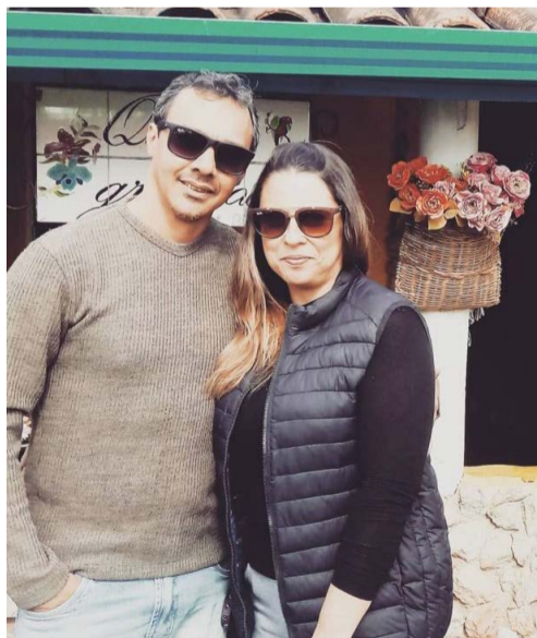
@alexandresammy – Alguém para crescer juntos!