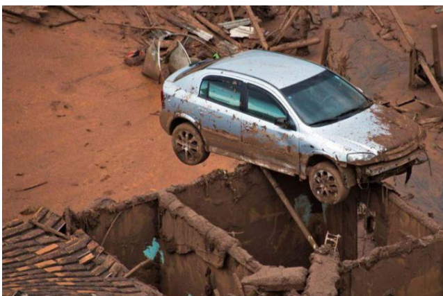
Tragédia de Mariana é considerado um dos maiores desastres ambientais do mundo

mil pessoas e entidades representadas pelo escritório Pogust Goodhead. No Brasil, todas as ações reparatórias são administradas pela Fundação Renova, entidade criada em 2016 conforme acordo firmado entre as três mineradoras, a União e os governos de Minas Gerais e do Espírito Santo. A causa pode chegar a R$230 bilhões.