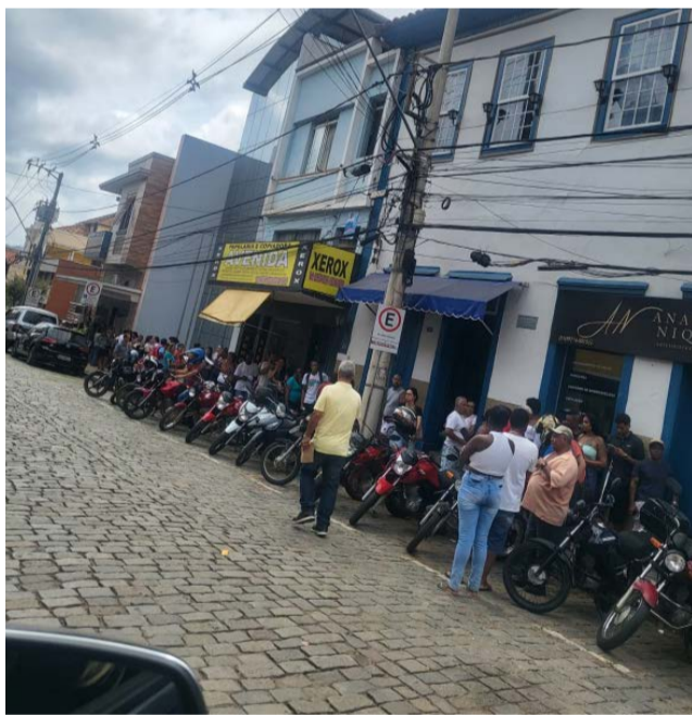
Filas imensas foram registradas em Ponte Nova para tentar indenização. Para o cadastramento os advogados cobravam cerca de R$ 100,00

A outra é a BHP Billiton, que tem sede em Londres e responde ao processo que tramita desde 2018 na Justiça inglesa. Ele foi movido por quase 200 mil de atingidos representados pelo escritório Pogust Good-