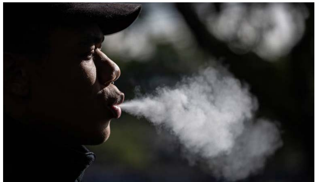
É mais fácil largar o crack que o cigarro, principalmente nas prisões

Quando Dr. Drauzio Varella perguntou se tinham sofrido com a abstinência do crack, os 03 (três) responderam que não. Um deles resumiu: