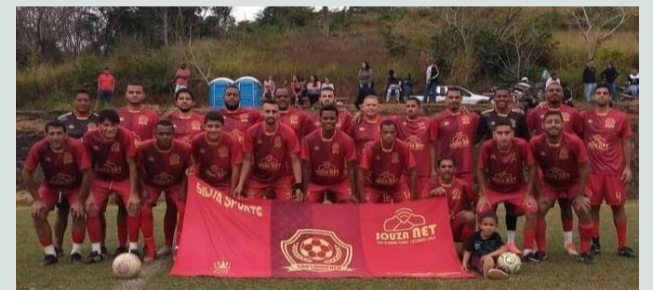
E.C Barraloungense classificou-se em cima do último campeão mineiro de Futebol Amador de Minas Gerais, Silvestre Futebol Clube, de Viçosa. Comemoração total