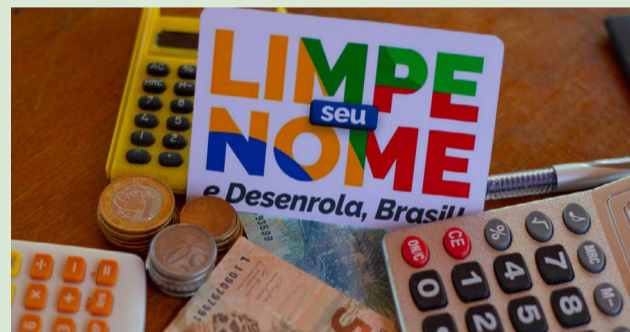
Mais de 30 milhões de pessoas serão beneficiadas nesta fase

A Faixa 2 do programa abrange a população com renda de 02 (dois) salários mínimos: R$ 2.640 até R$ 20 mil por mês. As dívidas podem ser quitadas nos canais indicados pelos agentes financeiros e poderão ser parceladas, no mínimo em 12 prestações. Também é necessário ter sido incluído no cadastro de inadimplentes até 31 de dezembro de 2022. Nesta fase do programa, também serão perdoadas dívidas bancárias de até R$ 100. Nesse caso, o nome da pessoa será retirado dos cadastros de devedores pelas instituições financeiras. Segundo o Ministério da Fazenda, com essa medida cerca de 1,5 milhão de pessoas deixarão de ter restrições e voltarão a poder ter acesso ao crédito.