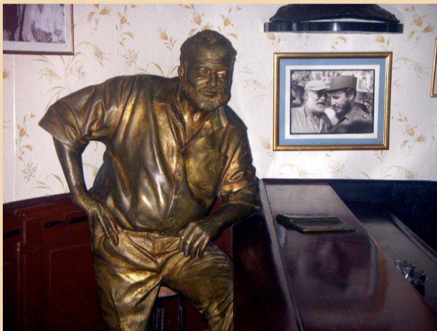
Estátua do escritor Ernest Hemingway no “Bar La Floridita” , em Cuba, ao lado uma fotografia do escritor com Fidel Castro, com quem manteve uma forte amizade, que durou 23 anos