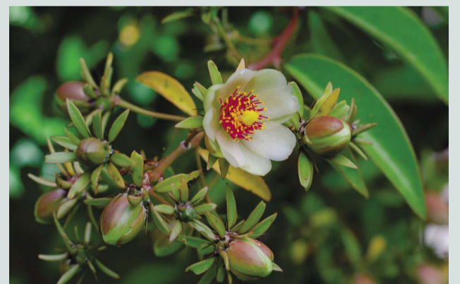
O lobrobô ou ora-pro-nobis é apreciado na culinária brasileira