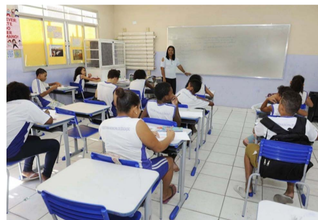
18 cidades das 24 que compõem a SRE de Ponte Nova receberão professores para as salas de aulas das escolas estaduais

Foi publicado no dia 18 de julho no Diário Oficial de Minas Gerais relação de mais 1.000 (mil) nomeações de excedentes do concurso público realizado em 2017. Serão ocupadas 500 vagas de Professores da Educação Básica e 500 vagas de Especialistas em Educação Básica. Na Superintendência Regional de Ensino (SRE) de Ponte Nova tem cerca de 5% das vagas, que inclui vagas para escolas estaduais de Ponte Nova, Viçosa, Abre