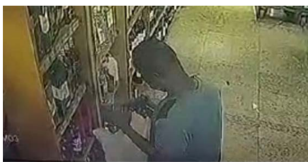
Print da imagem cedida pelo sistema de videomonitoramento à PM para averiguações e reconhecimento do assaltante

Ele foi preso e confessou o crime e afirmou ter vendido os objetos roubados. Com o autor foi encontrada a quantia