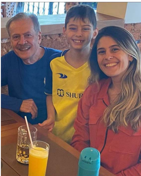
@raquelglinhares – Amores meus!