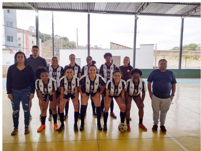
Equipe campeã do torneio relâmpago Ponte Nova: mulheres em quadra