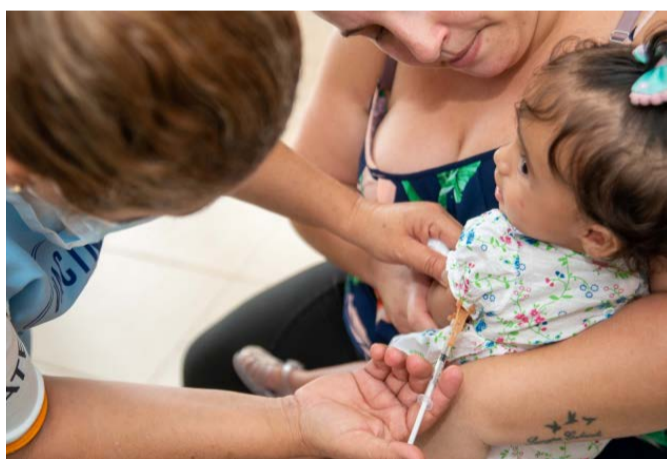
Vacinação contra a Influenza não atingiu 45% das crianças

A cobertura vacinal, especialmente para os grupos prioritários, que são: crianças de 06 (seis) meses a menores de 06 (seis) anos de idade (5 anos, 11 meses e 29 dias); trabalhador da saúde em setores públicos e privados; gestantes e puérperas; professores do ensino básico e superior; povos indígenas; quilombolas; idosos com 60 anos ou mais de idade; profissionais das Forças de Segurança e Salvamento e das Forças Armadas; pessoas com doenças crônicas não transmissíveis e outras condições clínicas especiais; pessoas com deficiência permanente; camioneiros, trabalhadores de