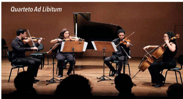
Quarteto Ad Libitum