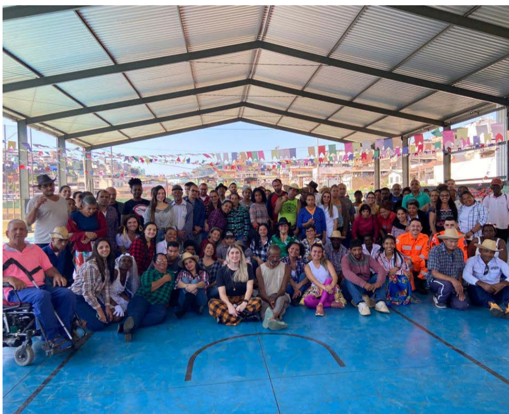
Momento final de congratamento do Arraiá do CAPS, no CMELC

caracterização e aulas de dança. Durante as apresentações, várias comidas típicas foram distribuídas aos presentes que prestigiaram o evento organizado pelos colaboradores do CAPS de Ponte Nova. Mais de 200 pessoas entre pacientes, colaboradores, familiares e visitantes.