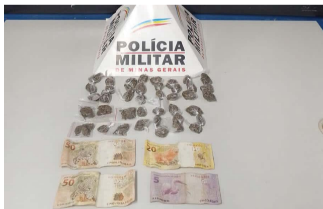
Droga foi encontrada pelos policiais militares com menor, que foi levado para a Delegacia Regional de Polícia Civil, para explicações e providências legais

De posse das informações, os militares se