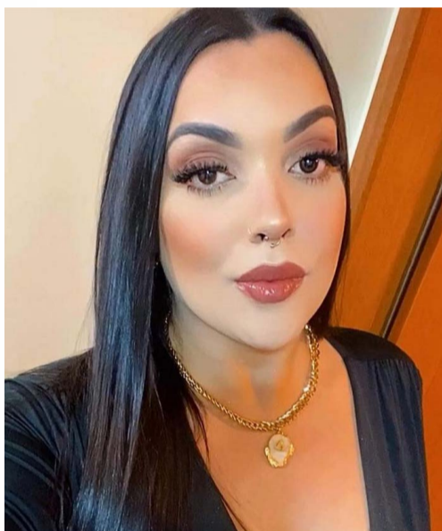
@aalicesartorii – Tudo em mim é muito intenso!

Coordenadores da Defesa Civil de 29 municípios da região reunidos no CIMVALPI para conhecer o Programa de Proteção e Defesa Civil, recém criada instituição regional. É mais uma ferramenta para garantir mais segurança, prevenção e proteção para os cidadãos. Parabéns a todos os envolvidos!