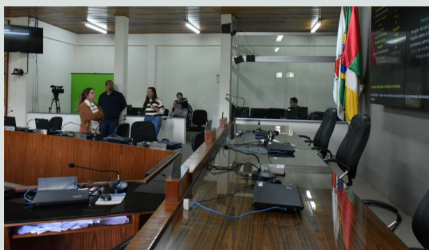
Servidores do Legislativo Viçosense conhecem de perto as ferramentas

O SAPL, que é utilizado pela Câmara de Ponte Nova, desde 2013, é disponibilizado pelo Interlegis, programa do Senado Federal, e ainda permite aos parlamentares a votação eletrônica das matérias em plenário. Durante a visita às dependências da Câmara,