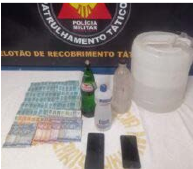
Clorofórmio, droga e dinheiro encontrados com homem preso, após mandado judicial criminal

No quarto, os militares acharam R$ 7.800,00, a quantia estava dividida entre os bolsos de várias calças e bermudas jeans. Também foram encontrados 02 (dois) aparelhos celulares. O homem se recusou a mostrar o