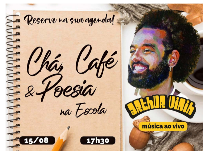
O card divulgado nas redes sociais é produzido pela Semctc

de Cultura, Turismo e Comunicação (Semctc), reúne cultura, bate-papo, com café e chá servidos com produtos caseiros como base de alimentação, como bolos e biscoitos. O projeto tem parceria com a Alepon (Academia de Letras, Ciências Artes de Ponte Nova), que cede membros para ler poesias. Desta vez, tem a presença do cantor e compositor Arthur Vinih. É só conferir!