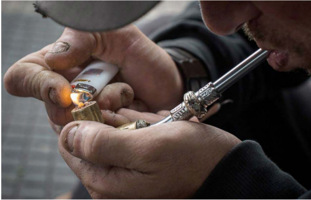
Muitos esqueceram a própria vida para se entregar ao crack

administração. Ao ser inalada, é absorvida pela mucosa das vias aéreas