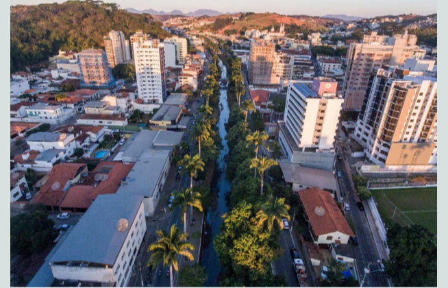
Ubá foi o palco de mais outro ato de violência doméstica, com o marido agredindo a mulher com o capacete

Seu estado é estável. O marido da vítima fugiu do local e ainda não foi localizado. O caso está sendo investigado pela Polícia Civil. A violência doméstica é crime que deve ser denunciado. Se você presenciou ou souber de um caso de violência doméstica, denuncie. Você pode ligar 180 ou fazer uma denúncia online no site da Polícia Civil.