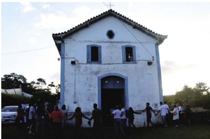
Capela de Nossa Senhora das Mercês, no antigo Distrito Bento Rodrigues, resistiu aos rejeitos da Samarco

Na ACP, o MP ressalta que, mesmo depois de meses da aprovação e do licenciamento do projeto, a Fundação Renova “não apresenta sequer um cronograma de