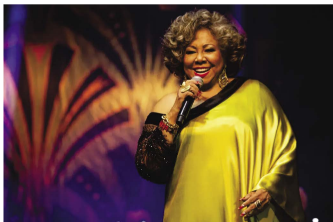
Alcione vem a Ponte Nova e canta seus sucessos de 50 anos de carreira

O Festival de 2023 tem programação de sobra e para todos os gostos e idades. Nesta sexta-feira, 21/07, surpresas pelas ruas da cidade; 22 de julho tem Festa da Goiabada; 27 de julho dance com o "Forró da Feira". Para o encerrar do mês, no Parque de Exposições, 30/07, tem Alcione, com o seu show de 50 anos de carreira.