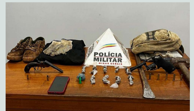
Material encontrado com os assaltantes na zona rural entre os municípios de Urucânia e Jequeri

Os três homens foram detidos pelos policiais militares e conduzidos para a Delegacia de Polícia Civil de Urucânia. Os materiais apreendidos servirão de base para a instauração do inquérito policial.