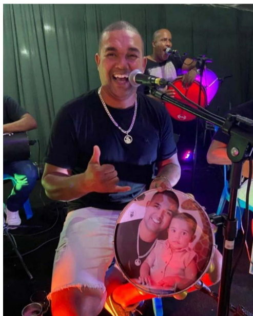
@alanfusão – Foto Top!