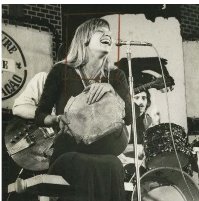
Rita Lee foi musa e ícone d'Os Mutantes