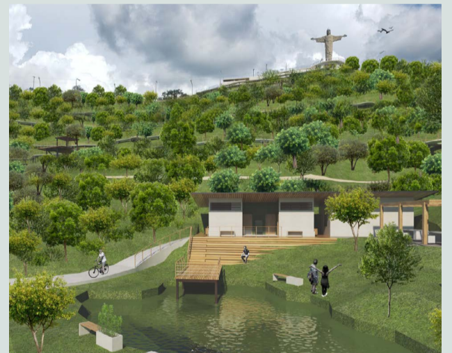
Uma das pranchas do projeto arquitetônico a ser implantado no Cristo Redentor de Viçosa

Para isso, o Instituto recebe recursos administrados pelo Ministério Público, oriundos de decisões judiciais que resultam no pagamento de multas aplicadas como punição por crimes ambientais.