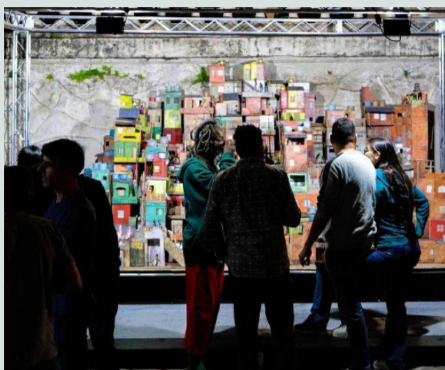
1ª edição do Reabolição aconteceu em 2022 e levantou diálogos sobre negritude e ancestralidade

Na sexta-feira e sábado próximos, 12 e 13 de maio, acontece mais 01 (uma) edição do evento "Reabolição", promovido pela secretaria municipal de Cultura de Viçosa. A ação promove a discussão sobre o dia da abolição da escravidão e tem sua programação voltada para a cultura afro-brasileira, trazendo atividades e debates focados na comunidade negra. O evento acontecerá na Estação Cultural Hervé Cordovil.