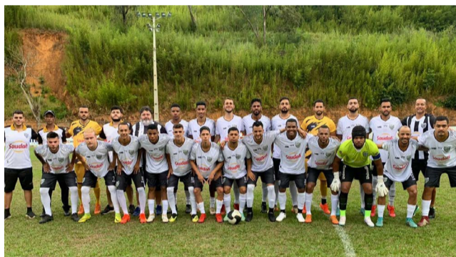
Piranga E.C surpreendeu a S.E.1º de Maio vencendo o jogo de ida por 4 x 1 e tem tudo para se classificar para a semifinal