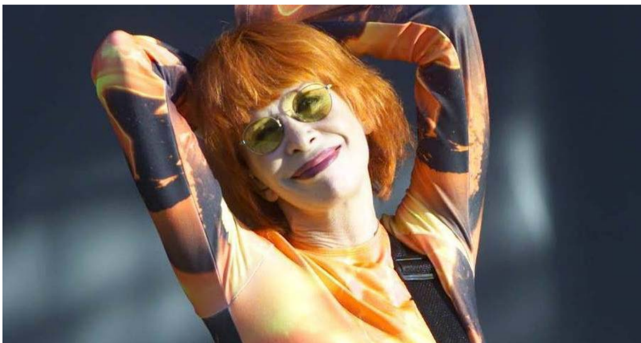
"Podem se esforçar muito, mas nunca haverá ninguém igual a Rita Lee", diz Ney Matogrosso sobre Rita Lee

Rita Lee foi presa grávida de seu primeiro filho, em 1976, durante a ditadura militar. A artista sempre bateu de frente com o regime fosse nas músicas ou nas atitudes e comportamentos em cima do palco e na sua vida pessoal. A PM de São Paulo "plantou macho na sua casa" . Não à toa ela leva a alcunha de "artista brasileira mais censurada" durante a ditadura.