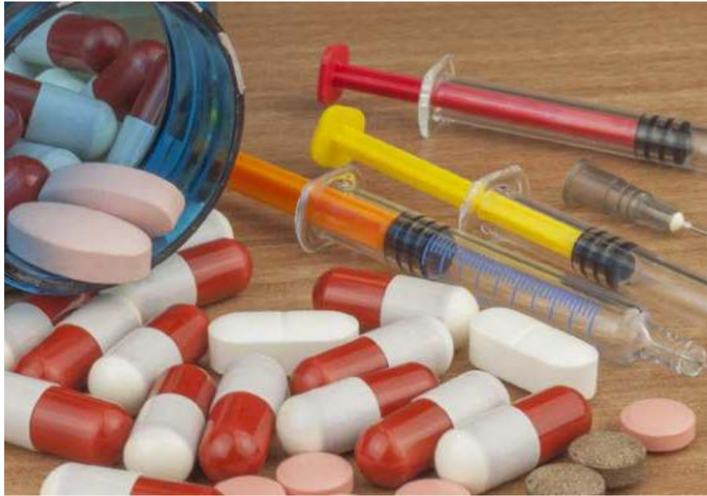
⚠ Esteroides anabolizantes pode aumento a pressão sanguínea; gera tumores no fígado e pâncreas; provoca alterações nos níveis de coagulação sanguínea e de colesterol, entre outros males

Anteriormente, as sociedades brasileiras de Cardiologia (SBC), de Endocrinologia e Metabologia (SBEM), de Urologia (SBU) e de Medicina do Exercício e do Esporte (SBMEE) e a Federação Brasileira das Associações de Ginecologia e Obstetrícia (Febrasgo) vieram a público pedir com veemência ao CFM, na figura do presidente José Hiran