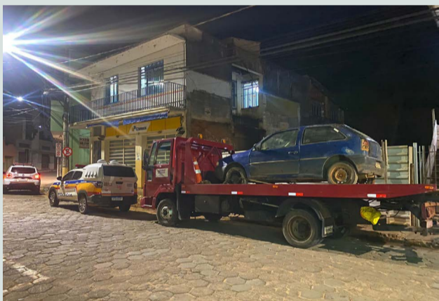
O GOL azul foi entregue para a Polícia Civil que procura o ladrão

cor azul. O carro foi furtado na cidade de Rio Casca entre os dias 30 de abril e 03 de maio, conforme queixa registrada e visualizada no sistema informatizado. Os militares receberam informações acerca do possível autor do furto, pessoa que teria sido vista deixando o veículo na Rua Vicente Felisbino. O carro foi entregue para Polícia Civil que investiga o caso e procura o ladrão.