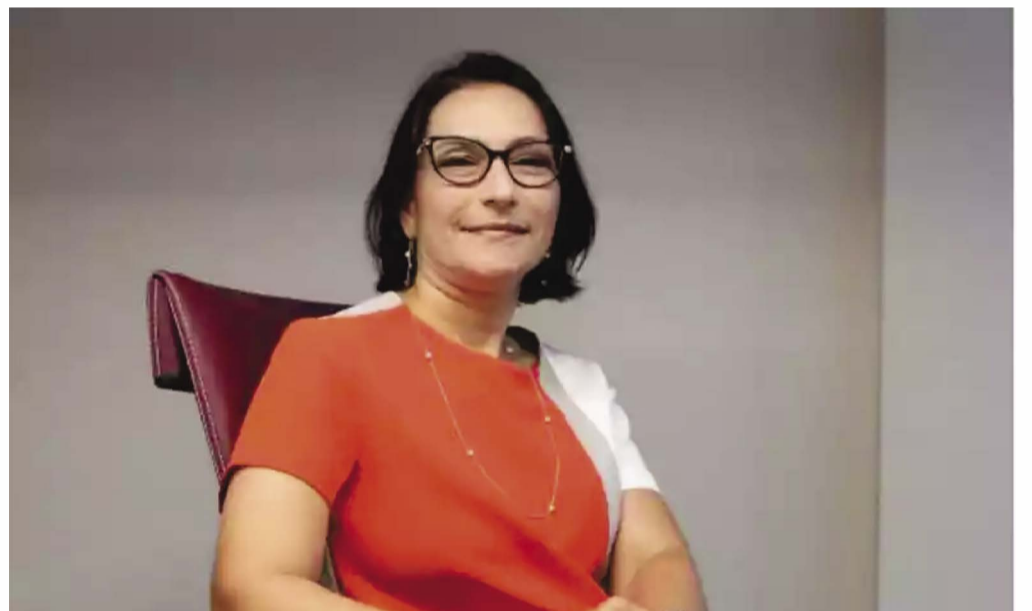
⚠ A médica endocrinologista mineira Flávia Coimbra é presidenta da SBEM-MG

Estamos preocupados com as mulheres que também estão buscando o uso dos esteroides anabolizantes, justamente para aumentar a força muscular, melhorar o desempenho nos exercícios e ficar com pernas musculosas e glúteos aumentados.