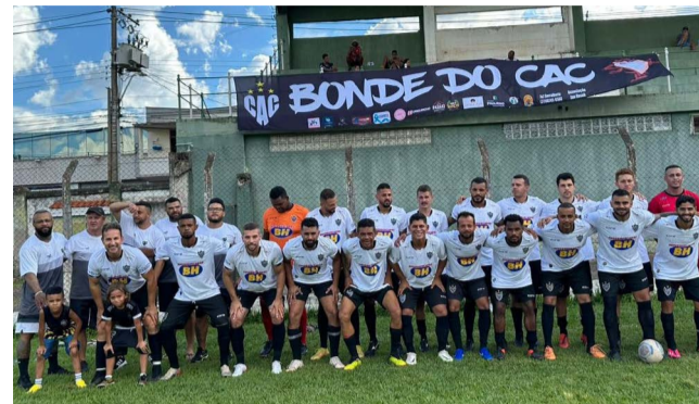
Clube Atlético Cohab, de Itabirito, precisa vencer o E.C. Barralonguense e esperar decisão de julgamento

pois estaria sendo ameaçado e hostilizado por atletas, dirigentes e torcedores. Ele saiu de campo escoltado por agentes da Polícia Militar. A direção da LMDPN resolverá este caso na Comissão Disciplinar da Supercopa, constituída por membros do Tribunal de Justiça Desportiva da Federação Mineira de Futebol. Espera-se que haja convocação de julgamento para os próximos dias.