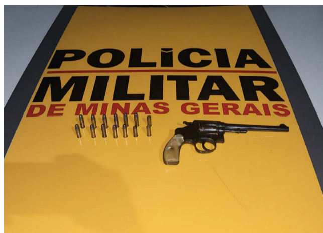
ⓘ Arma e munições apreendidas na rodovia que dá acesso ao município Santa Cruz do Escalvado

No domingo, 07 de maio, no início da noite (18h10min), a Polícia Militar Rodoviária realiza a operação antidrogas visando impedir o tráfico de drogas, porte de ilegal de armas de fogo e acidentes de trânsito na AMG 1705, rodovia de acesso ao município de Santa Cruz do Escalvado, quando abordou um veículo Ford KA.