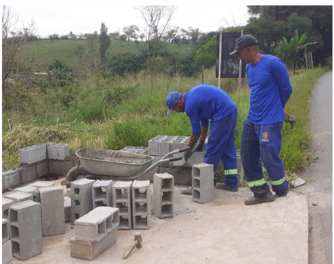
Construção de abrigo em ponto de ônibus da comunidade de Bom Será, nas imediações da Santinha do Vau Açu (MGC 120)