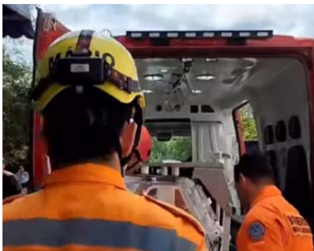
ⓘ Momento em que o recém-nascido vai para ambulância para ser levado ao aeroporto para ser transportado para Uberlândia

O recém-nascido precisará passar por cirurgia pediátrica no abdômen. Este procedimento não é realizado pelo HNSD de Ponte Nova e não havia vaga em Belo Horizonte. A criança foi levada para o Medical Center, hospital no município de Uberlândia, no Triângulo Mineiro. O bebê foi acompanhado pelo pai e todo o transporte foi feito via SUS (Sistema Único de Saúde).