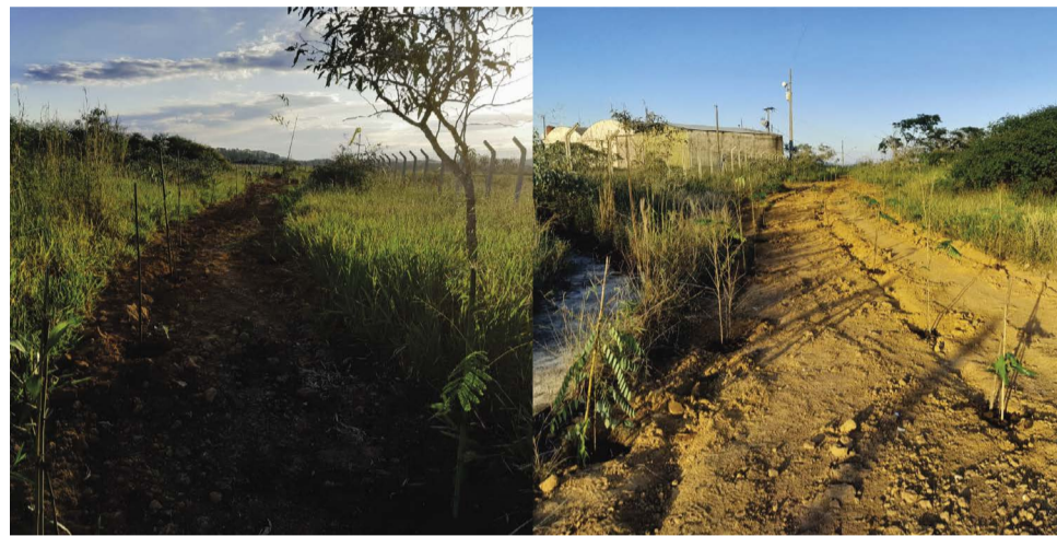
As mudas de árvores nativas plantadas ainda em abril de 2023 são provenientes do Viveiro de Mudas do Passa-Cinco e cedidas pela Semam

peração das áreas degradadas entre o aeroporto e mata da Fundação Menino Jesus (FMJ) conta com apoio do ambientalista Ricardo Motta, que esteve no local recentemente e propôs que seja realizada uma ação em 05 de junho, Dia Mundial do Meio Ambiente, com mutirão de plantio, com a parti-