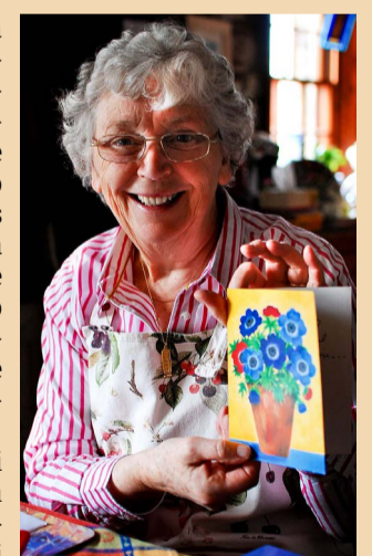
Mãe com cartão oferecido por seu filho

A festividade surgiu nos Estados Unidos, com a iniciativa da ativista Ann Maria Reeves Jarvis, que fundou em 1858 os Mothers Days Works Clubs com o objetivo de diminuir a mortalidade de crianças em famílias de trabalhadores. Jarvis organizou em 1865 o Mother's Friendship Days (dias de amizade para as