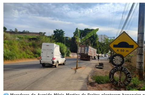
Moradores da Avenida Mário Martins de Freitas plantaram banana no asfalto para protestar contra o atrasado, mas o socorro está chegando, conforme divulgou a assessoria de Comunicação da Prefeitura.

DIA DAS MÃES Mãe, a maior influenciadora!