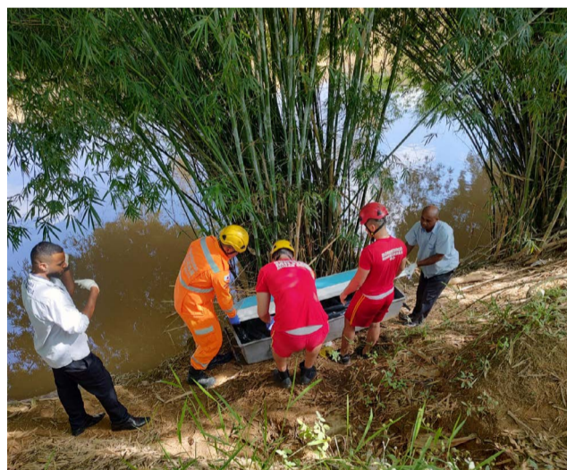
Bombeiros resgataram o corpo do homem que pulou no Rio Piranga, no Bairro da Rasa

Na manhã da quinta-feira, 04 de maio, o Corpo de Bombeiros de Ponte Nova foi acionado, após populares avistarem homem pulando de cima da Ponte da Barrinha, no Rio Piranga, próximo a câmara de Ponte Nova.