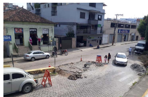
Calçamento foi recomposto na Rua Assad Zaidan entre a Agência do INSS e o entrocamento que dá acesso à Avenida Custódio Silva

impediam a circulação de carros e motos, além de dificultar a vida de pedestres, principalmente idosos e deficiente. A Semob anuncia para breve a recuperação da Avenida Mário Martins, saída para Rio Casca, logo após o Posto Vitória.