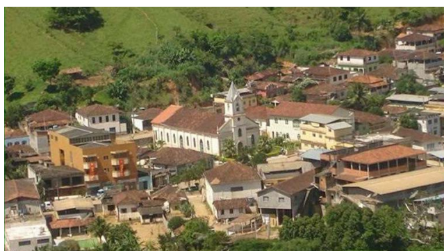
A cidade de São José do Goiabal terá equipe de Futebol pela 1ª vez no Regional do Açúcar, torneio organizado pela LDU: Goiabalense Futebol Clube