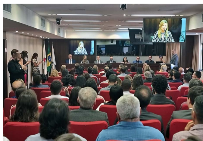
Dezenas de pessoas envolvidas na defesa do mundo animal participaram do evento do Ministério Público (Procuradoria de Justiça)