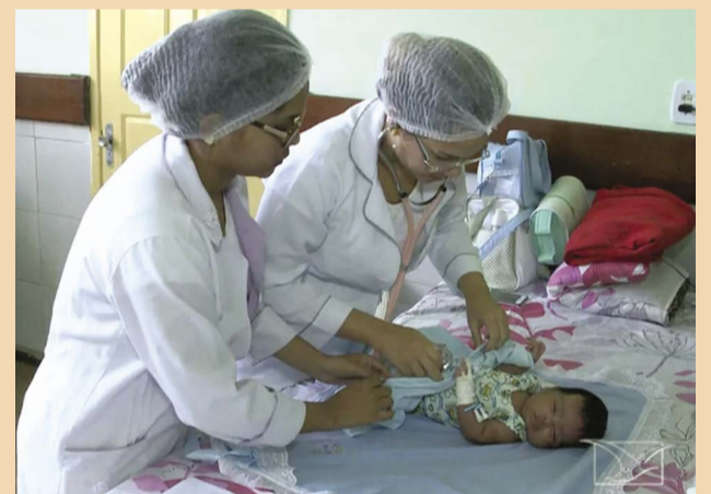
Enfermeiras trabalhando: cuidando de recém-nascido

O levantamento mais recente do Conselho Federal de Enfermagem aponta que, atualmente, mais de 693,4 mil enfermeiros atuam em todo o país (com 170,7 mil em exercício em São Paulo, estado com maior número de trabalhadores). De acordo com o mesmo banco de dados, o país conta com 450,9 mil auxiliares de enfermagem e mais de 1,66 milhão de técnicos de enfermagem, integrando cerca de 2,8 milhões de profissionais em atuação, nas 03 (três) funções em todo o país.