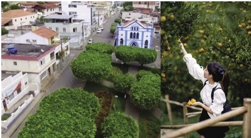
Em Tocantins, o Ministério Público do Trabalho investigou o uso de adolescente na colheita de laranja: é proibido pela Lista TIP

não contratar ou utilizar mão de obra de menores de 18 anos para o trabalho noturno, perigoso, insalubre e para as atividades relacionadas na Lista TIP, abstendo-se, ainda, de contratar ou utilizar mão de obra de menores de 16 anos, para qualquer tipo de trabalho, salvo na condição de aprendiz, a partir de 14 anos. Em caso de descumprimento, o valor da multa será de R$ 5 mil a cada constatação.