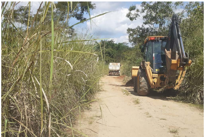
Máquina e caminhão da Sedru movimentam-se diariamente para a melhoria das estradas rurais

45 dias à frente da Sedru e planejamento para os próximos 60 dias, antecipando obras antes do período de chuvas. “Quando saí da Câmara de Ponte Nova (licenciado) disse que tinha compromisso de explicar o que teria feito em 45 dias. E assim vamos agir, com transparência, trabalho e apresentar soluções”, encerrou.