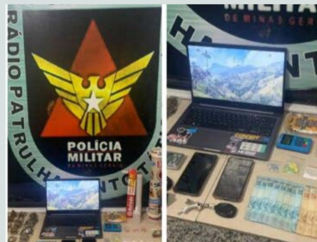
ⓘ Drogas pesadas apreendidas em boca de fumo em bairro de Viçosa

no Bairro São Domingos para conseguir dinheiro e comprar drogas: é usuário de crack. O autor do furto foi conduzido à Delegacia de Polícia Civil para as devidas providências.