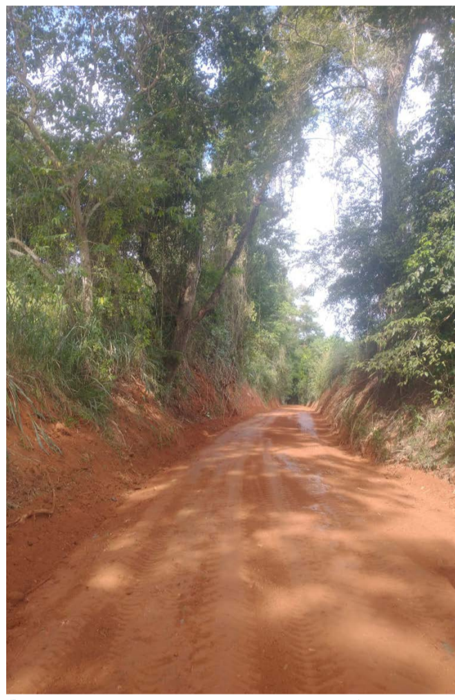
Sedru mostra resultado do trabalho na estrada de acesso às obras da ETE (Estação de Tratamento de Esgoto), logo abaixo da Rasa