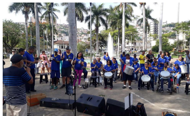
Apresentação da Banda de Percussão com alunos da APAE, no jardim de Palmeiras, em 10/05

Alunos da banda de percussão da APAE (Associação de Pais e Amigos dos Excepcionais) fez apresentação rápida na manhã de 10 de maio, no espaço de mul-