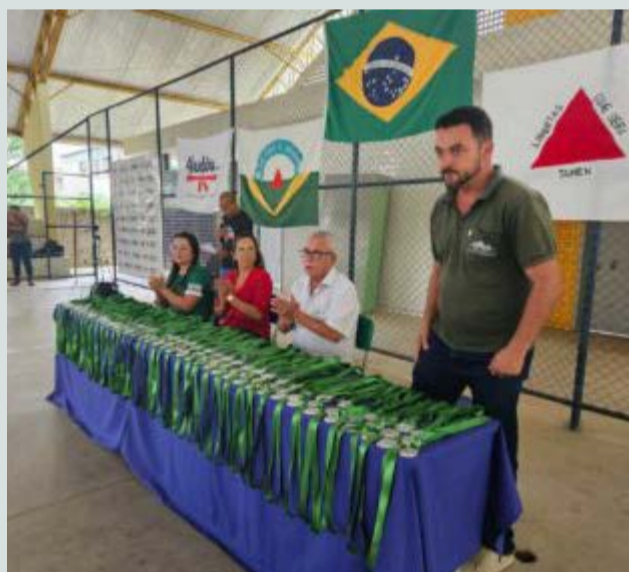
Mesa Diretora do torneio de judô em Viçosa, com patrocínio da CEMIG