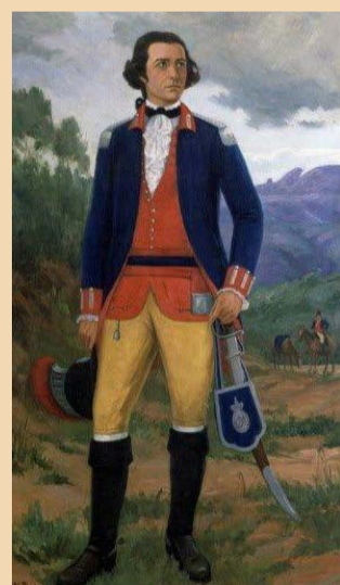
Tiradentes imberbe, como alferes, em pintura de José Wash Rodrigues

O resgate da figura de Tiradentes fez com que o dia 21 de abril, dia da sua morte, fosse transformado em feriado nacional. Isso aconteceu por meio de um decreto estabelecido durante o governo de Deodoro da Fonseca. O decreto nº 155-B, de 14 de janeiro de 1890, anunciava que o dia 21 de abril seria considerado dia dos "precurso-