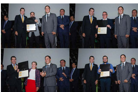
Momento de entrega do “Selo Bora Vacinar” Ouro, em Belo Horizonte, para os prefeitos que foram à cerimônia

xando-a com força, e ganha a que trouxe para o seu campo o galho amarrado no meio do cabo. A ação foi sucesso principalmente entre as crianças, que se empenharam em mais de uma revanche. A mesa de partilha de alimentos tradicionais da cultura puri foi, também, um momento muito forte. Sucos, broas, ovos, chás, frutas e legumes diversos foram servidos.