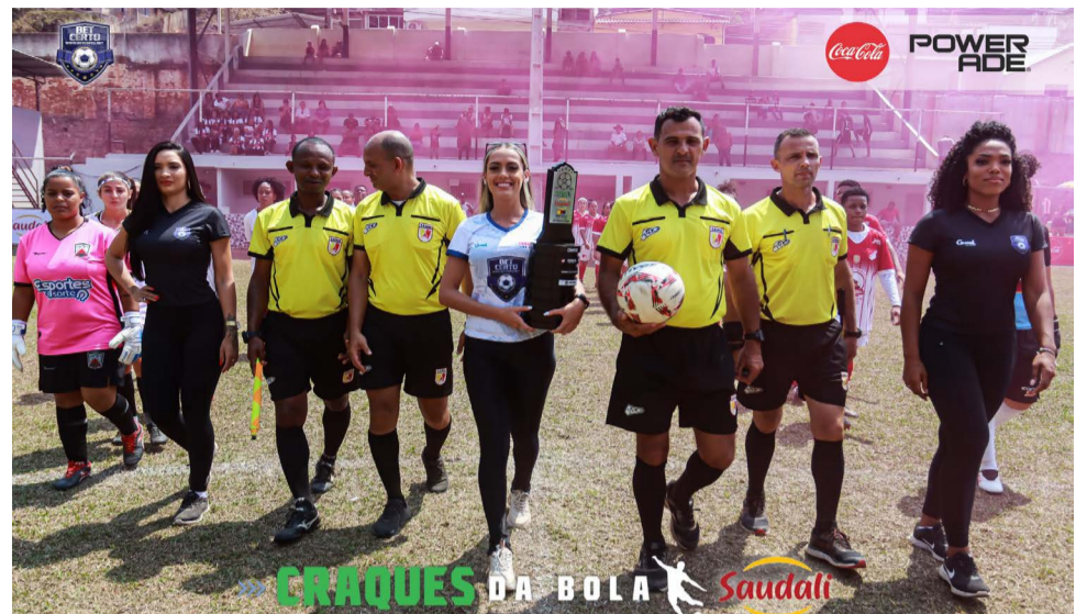
Última edição realizada em Ponte Nova, em 2022

De 29 de abril a 1º de maio, a várzea invadirá Ponte Nova, balançando todas as estruturas do Estádio Dr. Otávio Soares (Pito), campo da Sociedade Esportiva 1º de Maio. A 28ª edição do Craques da Bola chega a Ponte Nova promovendo espetáculos incríveis do legítimo futebol, que é a luta para verdadeira expressão que emociona o povo brasileiro.