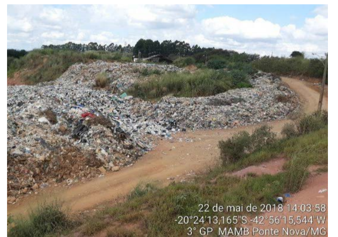
O Lixão do Sombrio foi multado em R$ 78 mil em 2018 por disposição inadequada de resíduos sólidos. Neste local deverá ser construída uma usina geradora de energia elétrica, a partir do lixo de Ponte Nova e de outras cidades

Em 2021, a Fundação Gorceix de Ouro Preto foi contratada para elaboração o PGIRS (Plano Intermunicipal de Gestão Integrada de Resíduos Sólidos) que abrangem aplicação de tecnologias, qual será a tecnologia e a contratação dessa tecnologia. A estimativa do plano é que cerca de R$ 96 milhões em investimentos privados sejam destinados apenas para a construção, no município de Ponte Nova, de uma usina de geração de energia a partir dos resíduos.