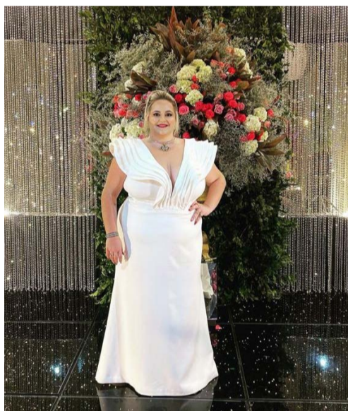
@julianacamposmarketing – Fato Empresarial!