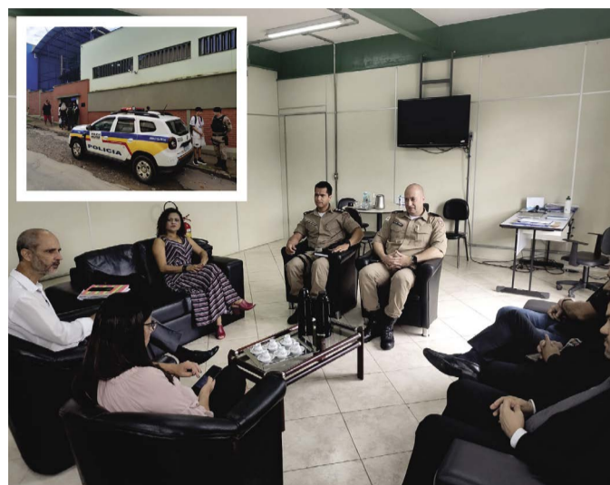
Depois da reunião no Gabinete do Prefeito Wagner Mol, a Polícia Militar manteve ronda nas portas e imediações das escolas de Ponte Nova

Os boatos sobre os ataques nas escolas surgiram nas redes sociais no final de semana domingo de Páscoa (09 de abril) e causaram alarde e medo na comunidade escolar como professores, alunos e funcionários. Os jovens usaram perfis falsos para postar imagens de armas de fogo, munições e facas, com mensagens indicando os nomes das escolas onde seriam realizados os ataques.