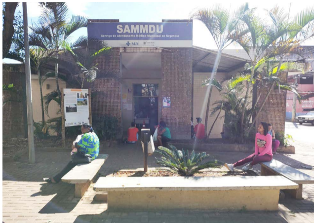
O SAMMDU registrou grande movimento de pacientes na manhã de 20/04