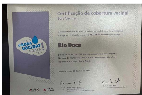
“Selo Bora Vacinar” Prata foi concedido ao município de Rio Doce pela cobertura vacinal em 2022