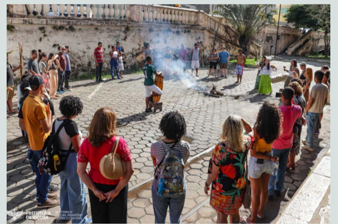
Cerimônia Kanareunde Puri realizada no “1º Kandura Puri”

Diversas lideranças regionais presentes no ato de abertura reforçaram a im-