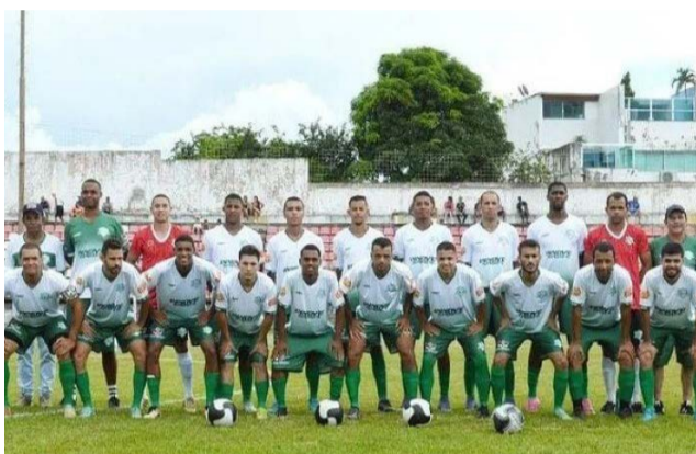
O VEL/Viçosa Esporte e Lazer disputa vaga fora dos seus domínios: Piranga