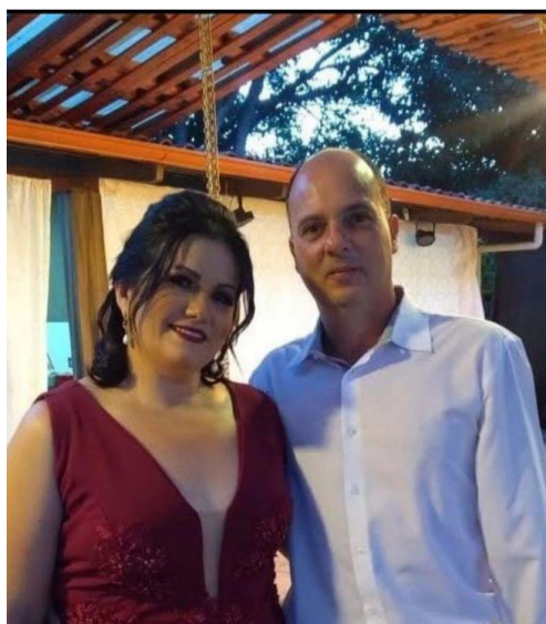
@crisbrittes17 – O amor é o sentimento mais forte!