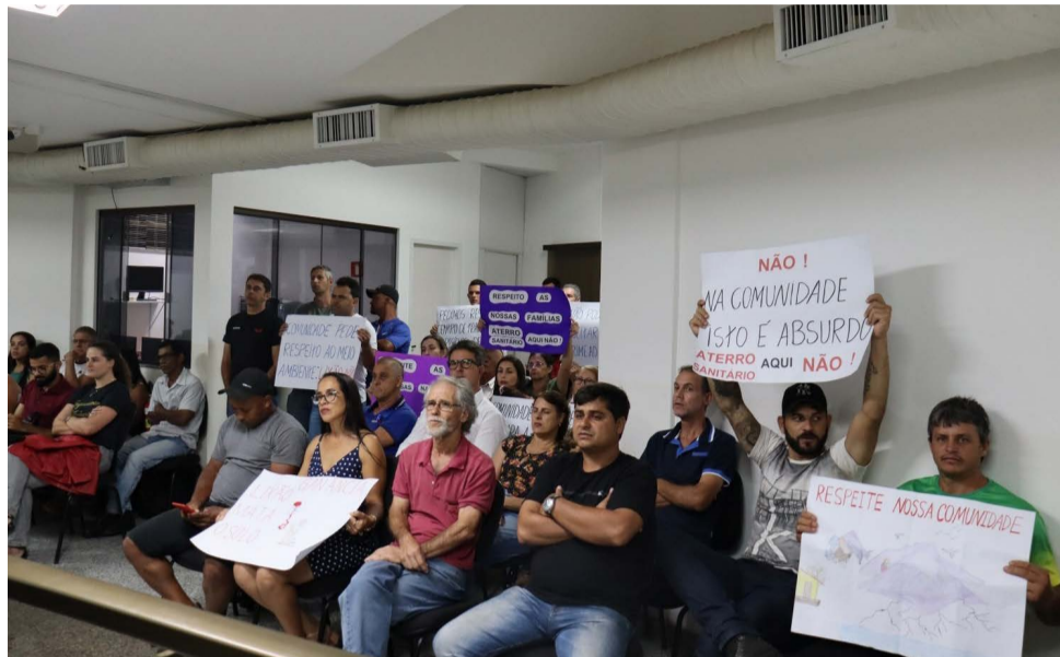
Moradores da comunidade rural do Barreiro em Manhuaçu não querem lixo perto de suas nascentes e áreas produtivas

Na sessão ordinária realizada na noite de quinta-feira, 13 de abril, a Câmara Municipal de Manhuaçu realizou a primeira discussão de 02 (duas) proposições que visam restringir a instalação de empreendimentos de aterro sanitário/usina geradora de energia no município. Um grupo de moradores da comunidade rural Barreiro, comunidade onde há um projeto de implantação de um centro de tratamento de resíduos, participou da reunião para manifestar sua posição contrária ao empreendimento.