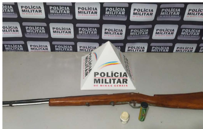
Arma de fogo (polveira) apreendida pela PM, em Urucânia

Joaquim, zona rural de Urucânia, os militares encontraram 01 (uma) espingarda polveira; 01 (um) frasco contendo pólvora e 01 (um) frasco contendo chumbos em cima de uma geladeira inutilizada, que se encontrava num dos cômodos da residência. Ele foi preso e já está detido na Delegacia de Polícia Civil de Urucânia.