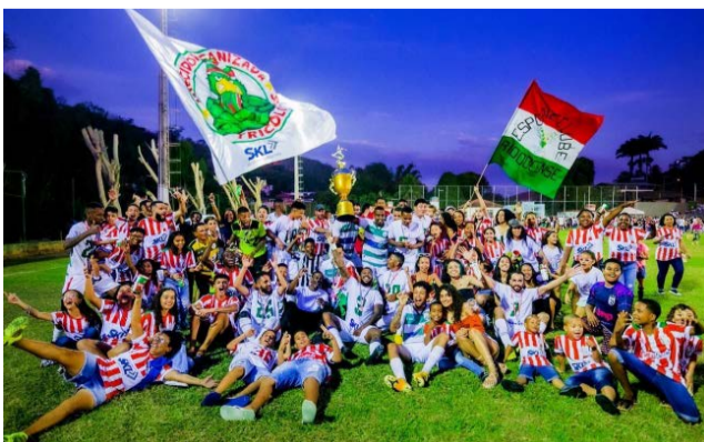
O E.C. Riodocense foi campeão do Regional do Açúcar em 2022