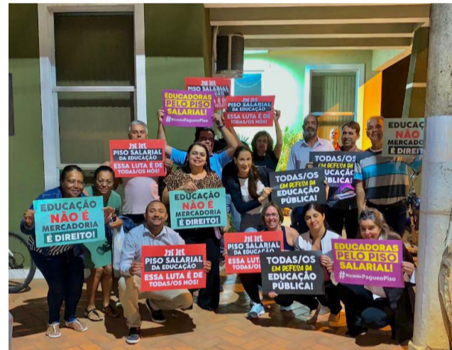
Greve dos professores de Cajuri foi suspensa pelo Tribunal de Justiça