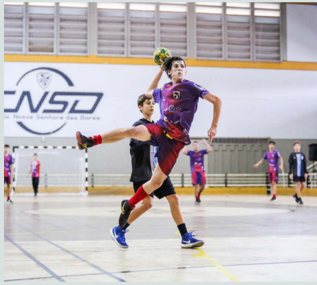
Definidas as séries microrregionais dos Jogos Escolares de Minas Gerais em 2023

Destinados a jovens de 12 a 17 das escolas públicas e particulares do Estado, os Jogos Escolares de Minas Gerais (JEMG) tem se tornado o maior evento esportivo/social do país. A competição vem batendo recordes de inscrições a cada ano. A competição é promovida pela secretaria de estado de Desenvolvimento Social (Sedese), por meio da subsecretaria de Esporte, em parceria com a secretaria de estado de Educação (SEE).