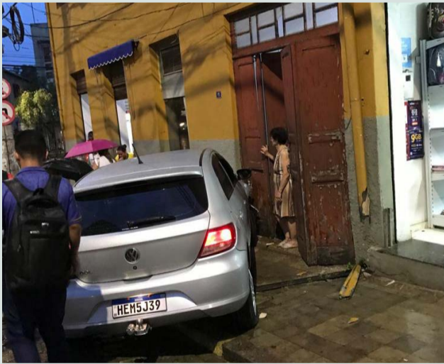
O veículo bateu na parede do casarão antigo, que ficou danificado perto da garagem

O veículo ainda bateu na parede do imóvel. O motorista, que foi liberado com seu carro (documentação legalizada), informou ainda aos militares acreditar que tenha passado por um mal súbito, situação que já teria ocorrido recentemente, quando perdeu a consciência e caiu ao solo enquanto fazia uma caminhada, tendo sido socorrido pelo Corpo de Bombeiros.