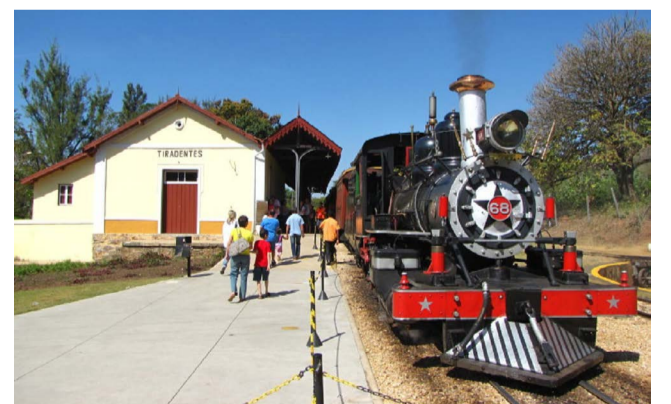
Ouro Preto e Tiradentes estão também conectadas fisicamente pelo trem de ferro turístico

Foi lá onde ocorreu uma das primeiras reuniões dos inconfidentes, quando