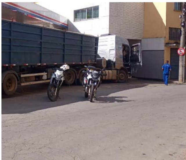
Carreta bateu na parede lateral do Auto Posto Rio Doce, na Abdalla Felício

Homem de 62 anos perdeu o controle direcional de sua carreta e invadiu a área lateral do Auto Posto Rio Doce, pelo acesso da Avenida Abdalla Felício. Equipe do SAMU Regional atendeu o motorista da carreta, que apesar de não apresentar nenhum ferimento, aparentava, segundo o profissional de saúde, estar sob o efeito de álcool. Agentes da Polícia Militar estiveram no local às 14h28min, conforme registro, no domingo, 16 de abril. A carreta (carroce-