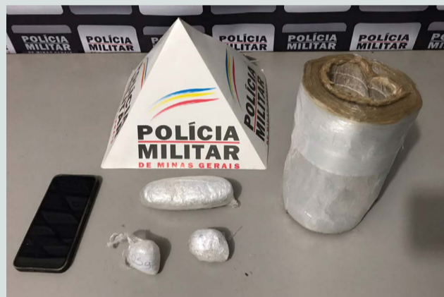
Drogas apreendidas pela PM em Urucânia

contraram em 01 (um) compartimento falso, protegido por peça de rodapé de cor preta, 03 (três) embalagens contendo pasta de cocaína; 01 (um) aparelho celular e 01 (um) rolo grande de plástico, geralmente usado para embalar porções de drogas para a venda. O homem foi conduzido para a Delegacia de Polícia Civil podendo ser enquadrado nos crimes de posse e venda de entorpecentes.