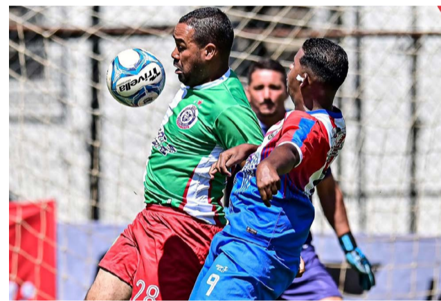
Lance de partida realizada no Festival Craques da Bola

Serão 03 (três) dias de bola rolando, tocando, charangas tocando, bandeirões flamulando e fazendo vibrar quem está dentro e fora das 04 (quatro) linhas. Nesta edição, as categorias de base também ganham destaque com as categorias 2012 e sub-17, além dos embates da categoria adulta.