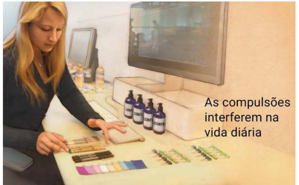
As compulsões interferem na vida diária

Existem dois tipos de TOC: Transtorno Obsessivo Compulsivo subclínico – as obsessões e rituais se repetem com frequência, mas não atrapalham a vida