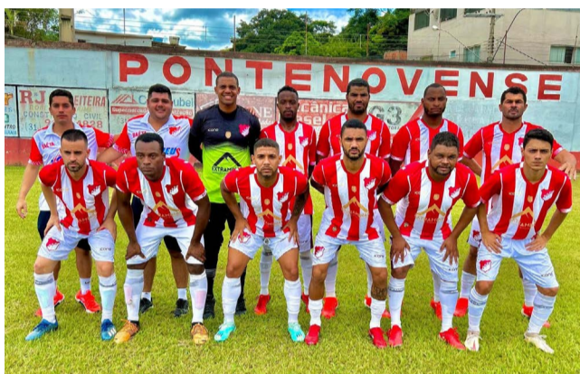
A equipe da Vila Oliveira, Pontenovense F.C está classificada para as quartas de final

regiões central e da Bacia Hidrográfica do Rio Piranga. Neste ano, a LMDPN tem parceria direta das ligas de Viçosa, Mariana, Ouro Preto e de Urucânia. Esta última é responsável pela Junta de Justiça Desportiva (JJD), que julga casos antidessportivos cometidos durante o certame.