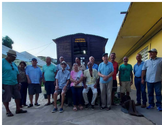
O último encontro dos ferroviários e voluntários da causa aconteceu em novembro do ano passado

30 de abril) no calendário oficial da cidade, resgates de peças para o museu, gravação de vídeos com quem de fato fez parte dessa história, mas o mais importante: aprender o passado, proporcionar encontros e homenagear quem moveu este país e impulsionou nosso crescimento.