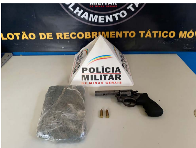
Arma e droga apreendidas no Distrito Vau Açu

Após denúncias recebidas, os militares apreenderam 01 (uma) barra de pasta base de cocaína; 02 (dois) cartuchos de munição calibre .38; 01 (um) revólver Taurus, calibre 38 e a motocicleta da fuga, 01 (uma)