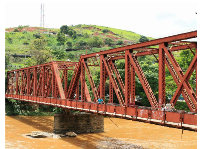
O Pontilhão de Ferro é o maior patrimônio ferroviário de Ponte Nova, mas precisa de cuidados