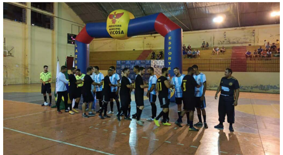
A primeira de abertura foi entre as equipes da Mundial Acabamentos e Reginaldo Alto Peças

Os times foram divididos em 02 (duas) chaves, que disputarão a fase de grupos. Na Chave A, estão as empresas Palha Leve, Transpezão, Haskell