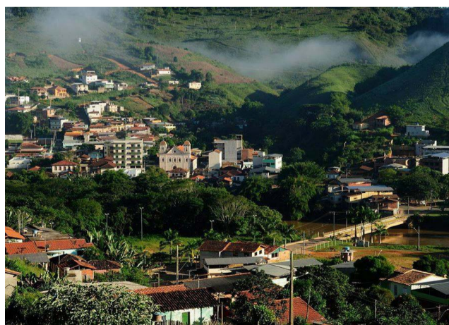
Guaraciaba é um município com vocação agrícola

A secretaria municipal de Desenvolvimento, Meio Ambiente e Produção Rural informa a todos pecuaristas da agricultura familiar do município de Guaraciaba que estão abertas as inscrições para o II