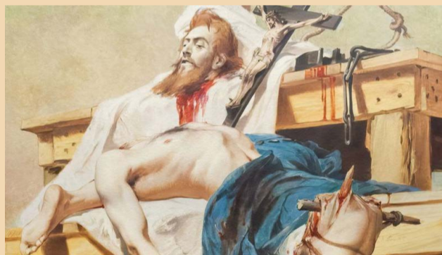
Tiradentes foi executado há 234 anos no Rio de Janeiro (Crédito: quadro de Pedro Américo)

A conspiração dos inconfidentes começou a ser preparada em 1788 para que as ações passassem a se realizar no ano seguinte. Tiradentes, por sua personalidade agitada, ficou conhecido como o mais radical dos inconfidentes, como diz o pesquisador Lucas Figueiredo, em seu livro "Boa Ventura! A corrida do ouro no Brasil (1697-1810)" .