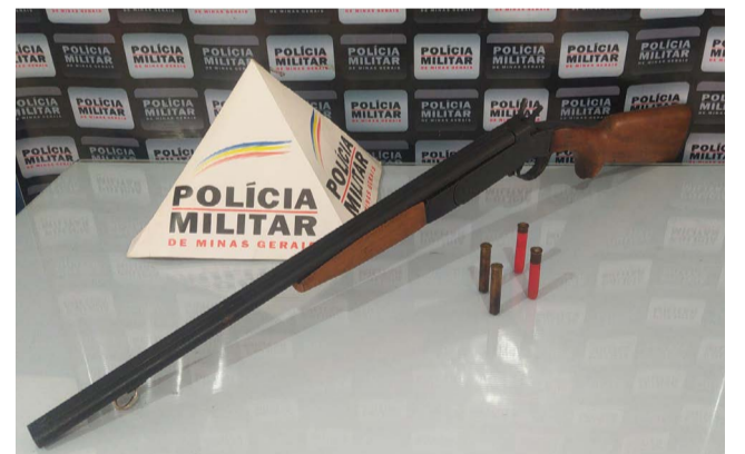
Arma e munições encontradas na residência do invasor de propriedade alheia

militares identificaram que era O1 (um) homem de 60 anos. Em sua residência, os militares encontraram dentro de um guarda-roupas uma espingarda calibre 36 e 04 cartuchos deflagrados. Ele recebeu voz de prisão e encaminhado para a Delegacia de Polícia Civil. Responderá pelo crime de posse ilegal de armas e terá que dar explicações sobre a invasão de propriedade.