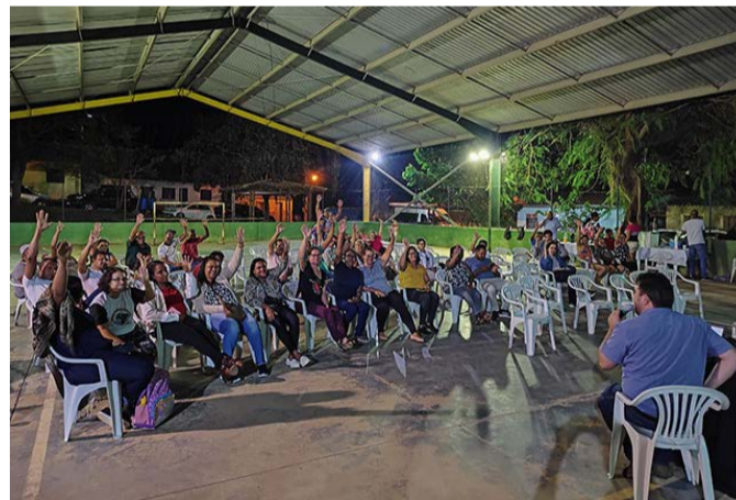
Moradores de Gesteira em reunião com os representantes do MPMG e MPF

A Fundação Renova já apresentou proposta de reassentamento e abriu espaço para novos debates e discussões sobre o tema