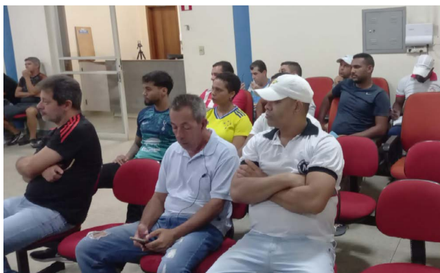
Flagrante da reunião na Câmara de Urucânia

dia 08 de maio haverá sorteio online dos grupos em que as equipes disputarão a fase classificatória. O Campeonato Regional do Açúcar teve como campeão no ano passado (2022) o Esporte Clube Riodocense.