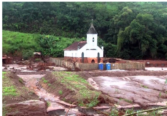
A comunidade rural de Gesteira foi duramente atingida pela lama de mineração em 2015

As negociações estão ocorrendo no âmbito da 4ª Vara Federal de Belo Horizonte, sob a condução do juiz Michael Procópio. No dia 24 de abril, na segunda-feira, está prevista a próxima audiência de conciliação.