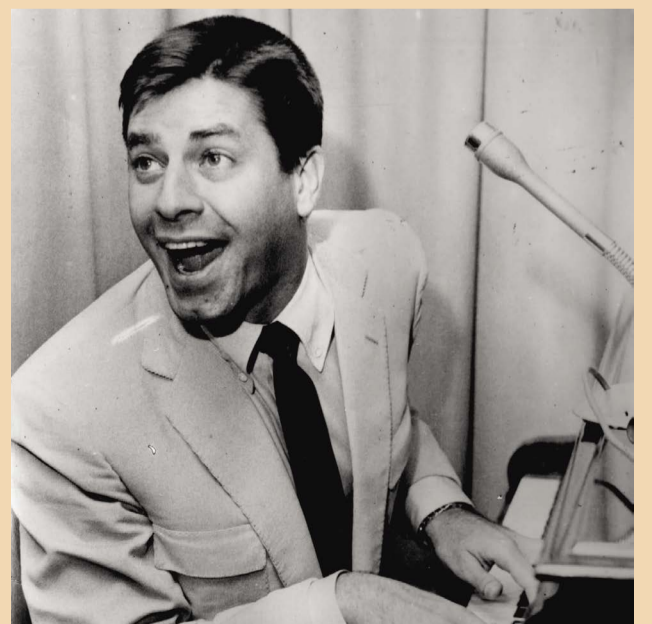
A foto mais icônica de Jerry Lewis

Jerry Lewis também foi creditado como inventor do vídeo assist system, que possibilita maior visibilidade como ator e diretor ao mesmo tempo, durante a gravação de um filme (algumas pessoas contestam isso). Lewis também fez parceria com o cantor e ator Deam Martin em 1946, formando a dupla Martin e Lewis Fizeram sucesso em casas de shows e em filmes para a produtora cinematográfica Paramount. Os dois se separaram dez anos depois.