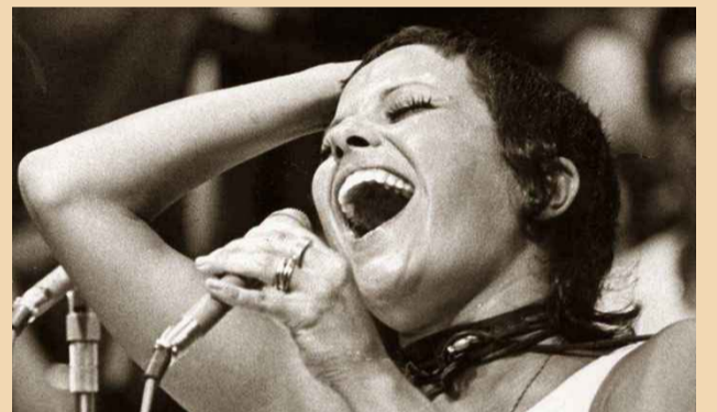
Elis Regina interpretando a música de autoria do ponte-novense João Bosco e do carioca Aldir Blanc (tetrista)

Depois de quatro LP's gravados e sem grande sucesso: Viva a Brotolândia (1961), Poema de Amor (1962), Elis Regina (1963), O Bem do Amor (1963), Elis Regina foi a maior revelação do festival da TV Excelsior em 1965, quando cantou “Arrastão” de Vinícius de Moraes e Edu Lobo. Tal feito lhe garantiria o convite para atuar na televisão e, pouco tempo depois, o título de primeira estrela da canção popular brasileira, quando passou a comandar, ao lado de Jair Rodrigues um dois mais importantes programas de música popular brasileira, O Fino da Bossa.