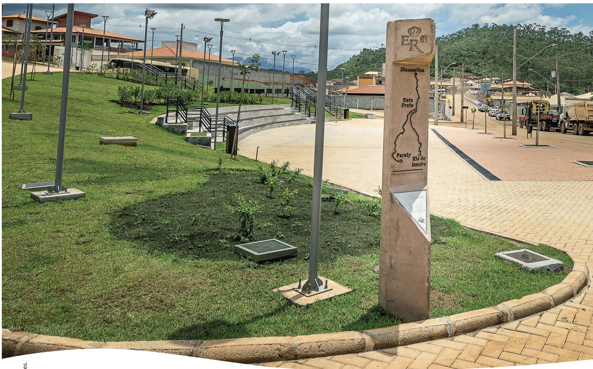
Marco da Estrada Real localizado na praça São Bento, no novo distrito de Bento Rodrigues.