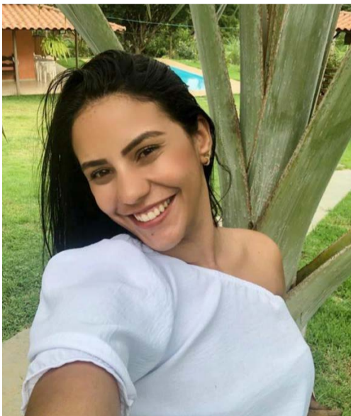
@thais_Inna – Feliz aniversário!