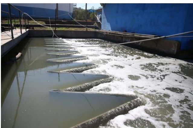
A nova lei ambiental obriga reaproveitamento de água de esgoto e de chuva

O Projeto de Lei foi apresentado em 2012 pelo então deputado Laércio Oliveira (PP-SE), agora no mandato de senador. A matéria foi aprovada na Comissão de Meio Ambiente do Senado, em dezembro de 2021, com parecer favorável do relator, senador Otto Alencar (PSD-BA), que