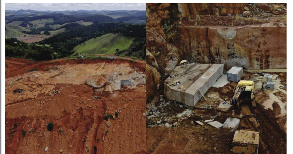
A extração ilegal de granito detonou a área explorada, incluindo um nascente, considerada área de preservação permanente

Os militares apreenderam 07 (sete) tratores de esteira, escavadeira, pá-carregadeira e empilhadeira, 03 (três) caminhões e 02 (duas) caminhonetes, além de 02 (dois) geradores de energia, 04 (quatro) máquinas de fio diamantado, 02 (duas) máquinas perfuratrizes e motores, que somados, perfazem a quantia de R$ 4.729.000,00. As atividades de extração de granito estão foram suspensas até que empresa faça a devida regularização.