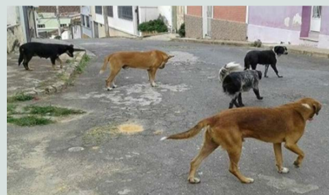
A realidade dos cães que estão nas ruas de Ponte Nova é muito diferente da vida dos cães que vivem no Canil Municipal

O deputado federal Rodrigo de Castro (União Brasil-MG), natural de Viçosa, o mais votado em Ponte Nova (5.040 votos), foi eleito na quarta-feira, 15 de março, presidente da Comissão de Minas e Energia (CME) da Câmara dos Deputados. Ele recebeu 29 votos e 01 (um) voto em branco. Os demais dirigentes da CME (03 vice-presidentes) serão eleitos em outra data.