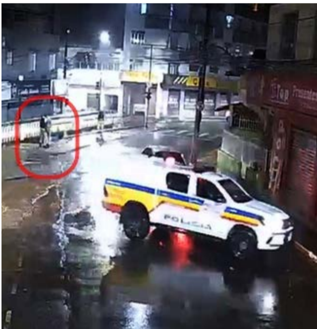
Momento da prisão do estuprador, que vai responder em liberdade

Adolescente de 17 anos foi estuprada em Viçosa na última sexta-feira, 10 de março. A vítima estava procurando um carro de aplicativo, na Praça do Rosário, quando um homem se apresentou como motorista do aplicativo e se ofereceu para levá-la para casa.