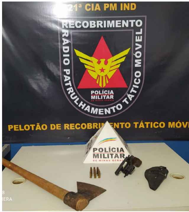
Machado usado para ameaçar a companheira e arma apreendida pela PM está na DRPCPN

No dia 11 de março, uma mulher de 48 anos estava sendo ameaçada pelo companheiro no Bairro Jardim que faz divisa com o Bairro Guapiranga, precisamente na Rua Sinésio Moreira dos Santos. Este fato foi registrado pela Polícia Militar às 15 horas, quando foi acionada. Os policiais militares abordaram um homem de 46 anos dentro de seu veículo. Contra ele havia uma denúncia de agressão e ameaça que ele teria realizado no dia anterior, utilizando um machado. Depois de ouvir o homem, a viatura policial deslocou-se para o Povoado Cedro, zona rural de Ponte Nova, com acesso pelo Anel Rodoviário, ao lado do Lixão do Sombrio. Na casa do casal, os militares encontraram 01 (um) revólver, calibre 38; 09 (nove) munições intactas, calibre .38 e o machado que teria sido utilizado nas agressões e ameaças. O homem foi preso com base na Lei Maria da Penha e conduzido para a Delegacia Regional de Polícia Civil de Ponte Nova (DRPCPN) onde permaneceu preso aguardando os procedimentos judiciais. Ele vai responder, também, por posse ilegal de arma de fogo e munições.