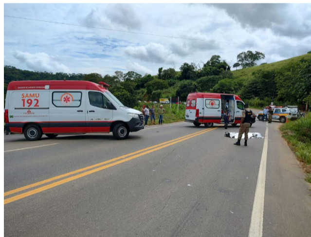
O corpo ficou estendido no asfalto até a realização de diligência com apoio da Polícia Militar e do SAMU Regional