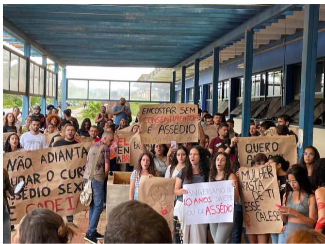
Alunas denunciam assédio sexual de um professor da UFOP e pedem sua exoneração

No entanto, essa não foi a primeira ação do grupo, que na semana passada divulgou uma nota em suas redes sociais sobre o mesmo tema. No documento, o CALMED relatou abusos de um professor e pediu sua exoneração. Embora o nome do professor não tenha sido revelado, a declaração afirmou