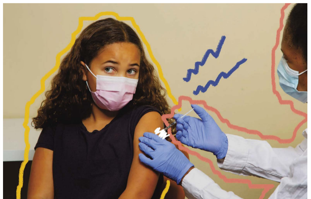
🔗 Crianças em casa-abrigo têm prioridade para vacinação com a bivalente

Desde o início da pandemia, o Brasil tem