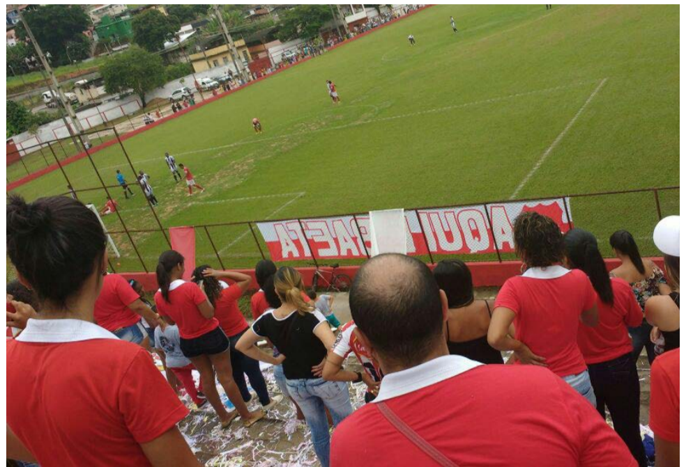
A equipe do Pontenovense FC enfrenta o Real A.C em seu estádio, na Vila Oliveira

A competição prossegue nos dias 18 e 19 de março, com os seguintes jogos: às 15 horas, em Ponte Nova, Estádio Mário Lobo (Pau d'Alho) entram em campo S.E 1º de Maio x Viçosa Esporte e Lazer/VEL; em Ouro Preto, Morro