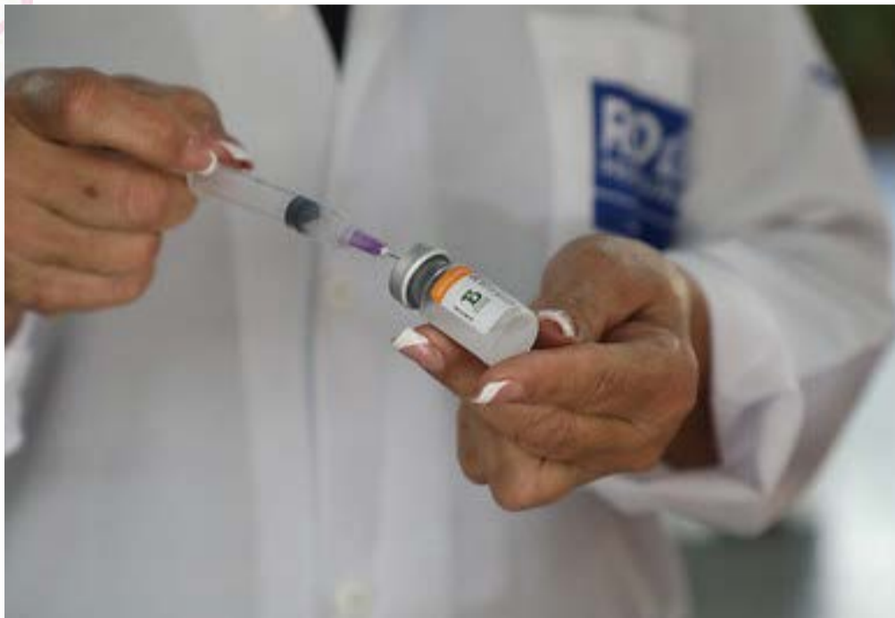
🔗 Vacina bivalente é necessária para conter a expansão do coronavírus

“Falar de COVID-19 virou fora de moda”, escuta-se nas ruas e em conversas com