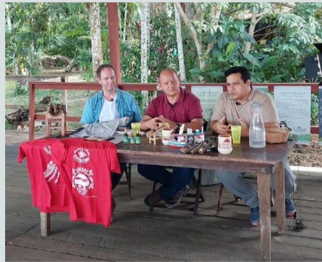
Professores da Cátedra Unesco da UFV e da Unama debateram desenvolvimento de economia sustentável

Em breve, uma série de vídeos, de forma coparticipativa e solidária entre a UFV e a Unama, sobre Economia Criativa na Amazônia, será disponibilizada na plataforma streaming de acesso aberto e gratuito Unama Play. Eles abordarão temas de interesse internacional, como Tecnologias, Turismo Sustentável, Geração de Valor em Comunidades e Negócios Criativos.