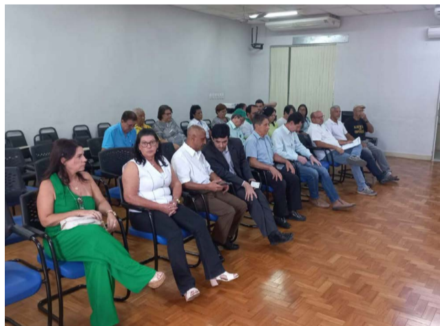
Reunião em Manhuaçu definiu os membros da sociedade civil no CMA e elegeu o presidente

Antes disso, ele foi o principal articulador com outros ativistas para criar as leis ambientais de Ponte Nova, inclusive de criação do Parque Natural Municipal Tancredo Neves; proibição de hidrelétricas no Rio Piranga e formatação da emenda que criou a secretaria municipal de Agricultura, Pecuário e Meio Ambiente, em 1990.