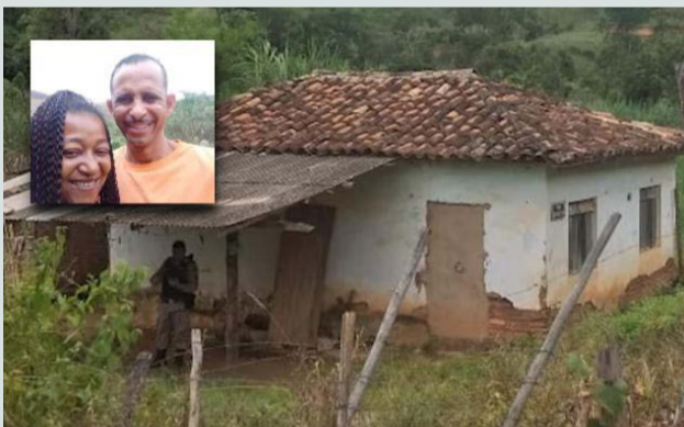
Fotomontagem com fotos do casal e casa onde houve o assassinato

O delegado da Polícia Civil de Bom Jesus do Galho, Sávio Squasher, citou elementos que apontam a autoria para o suspeito detido, além de uma testemunha que disse ter visto esse homem por volta de 23 horas na casa das vítimas. Chinelo, marcas de sangue na casa do indivíduo e no próprio corpo dele e lesões sugestivas de confronto pessoal reforçam a tese. O homem preso nega os fatos.