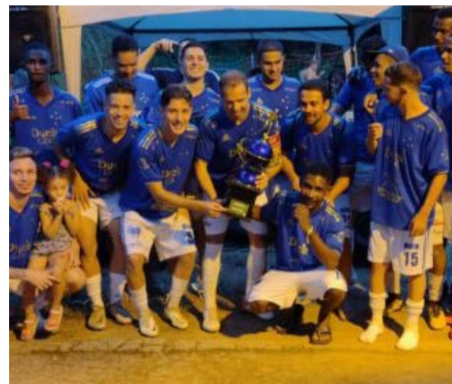
Raposa Viçosa vence FlaViçosa e levanta título das torcidas

No último sábado, Torneio de Torcidas entre Cruzeiro e a FlaViçosa. A iniciativa beneficente que