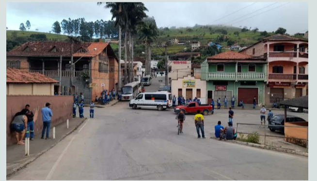
Acaiaca foi palco de violência contra a mulher, que está internada em estado grave, com queimaduras

A mulher queimada ainda está internada na CTI do Hospital Arnaldo de Acaiaca na companhia de 03 (três) rapazes. Segundo a Polícia Militar, todos fizeram uso de bebida alcoólica e 01 (um) deles teria atestado fogo na praça principal de Acaiaca, em Belo Horizonte, em uma tentativa de homicídio. Conforme os militares, o suspeito buscou o galão de combustível em casa. Os outros 02 (dois) ligaram imediatamente para a Polícia Militar que tomou as providências para levar a mulher para Ponte Nova. O crime foi registrado semana passada, dia 06 de março. A vítima estava em uma praça