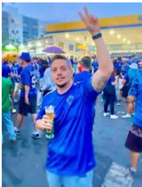
@rrfontes90 – Cruzeiro Esporte Clube