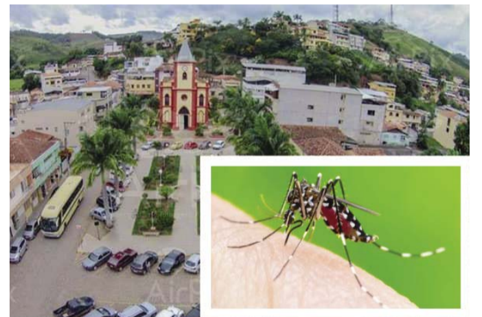
Teixeiras monta força-tarefa para combater o mosquito Aedes Aegypti

O objetivo é deixar o HSA para o atendimento de casos mais graves e que todos os casos leves sejam atendidos nos PSF's. Todas as unidades básicas de saúde