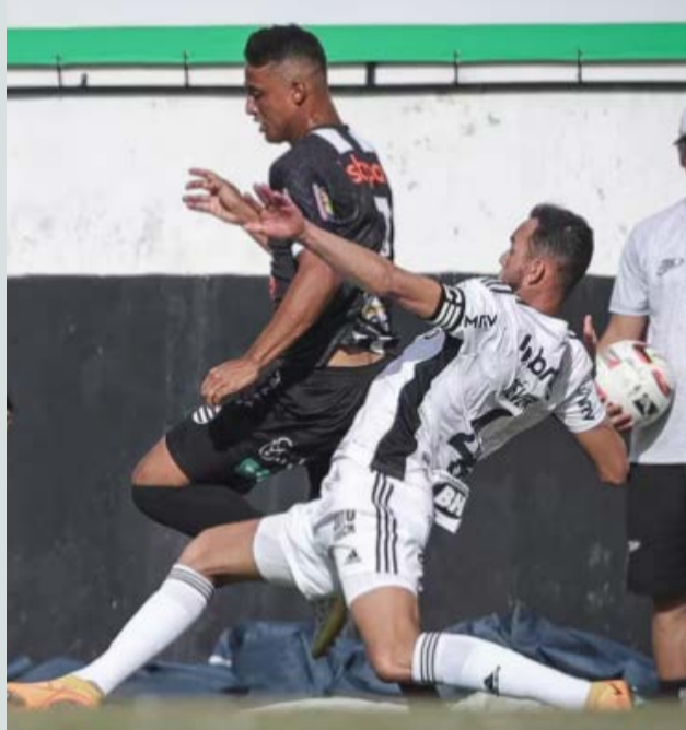
Athletic Club (São João Del Rei) larga na frente e joga pelo empate para chegar à final do Mineiro