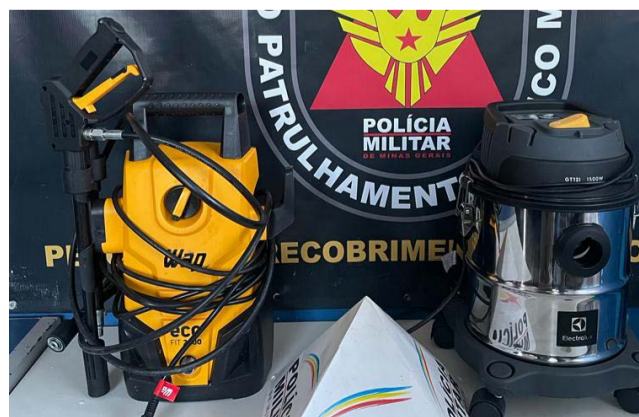
Os utensílios domésticos foram encontrados no Conjunto Habitacional Dalvo de Oliveira Benfeito (Vila Alvarenga) nos dias 07/03 e 09/03, com receptadores.

O homem e a mulher foram presos por receptação de produto de furto. A Polícia Militar tem informações sobre os suspeitos de cometer o furto e segue em rastreamento na tentativa de localizar e prender os autores.