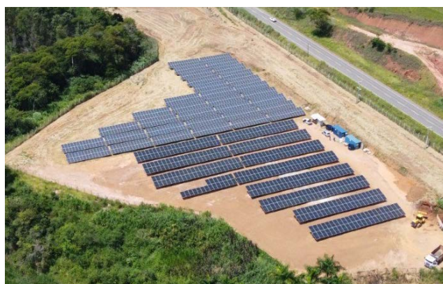
O Parque de Geração Fotovoltaica está localizado às margens da Rodovia MGC-120, próximo ao aeródromo de Viçosa, onde funcionava a antiga usina de álcool da UFV

A UFV informou: “A instalação de todos os módulos trará não apenas uma economia maior nos