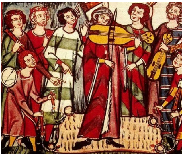
A música era uma realidade na Idade Média

A Cultura Medieval é caracterizada pela influência da igreja católica sobre as culturas greco-romanas e germânicas durante a Idade Média. Nesse contexto, entende-se como cultura todas as atividades relacionadas à educação, à ciência, à filosofia, à arquitetura e à música, entre outros elementos.