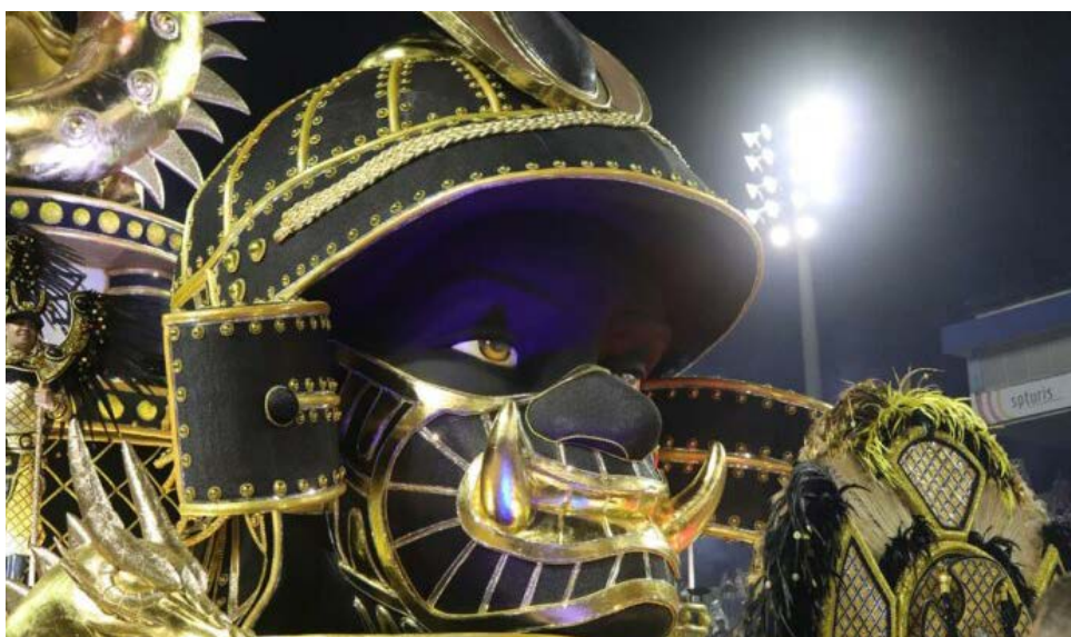
Carro alegórico da Mocidade Alegre mostra a vida do negro moçambicano Yasuke, que se transformou em samurai no Japão

A noite brilhou em São Paulo com a prestigiada Mocidade Alegre, com seus 10 títulos de campeã, e o enredo Yasuke. A escola soube explorar, em 2023, aspectos da cultura nipônica medieval vencida pelo negro moçambicano que se tornou samurai, para mostrar “que todo preto pode ser o que quiser!” Agora, campeã, a Mocidade Alegre tem 11 títulos.