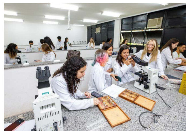
Estudantes bolsistas vibraram com o reajuste anunciado por Lula: em favor da ciência brasileira!

Também na tarde desta quinta-feira, a Fundação de Amparo à Pesquisa do Estado de Minas Gerais (Fapemig) anunciou reajuste nas suas bolsas de pesquisas. As bolsas de pós-graduação terão um aumento de 40%: no caso do mestrado, o valor irá de R$ 1.500,00 para