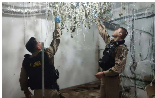
📍 Buchas de skunk penduradas em laboratórios desmontados por policiais militares, em Viçosa

Entre os presos havia em 01 jovem de 22 anos, procedente do município de Ponte Nova e 08 do Vale do Aço