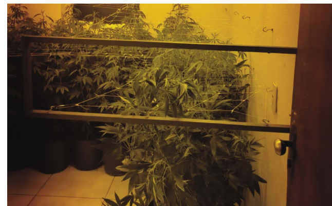
📍 Cultivo de cannabis sativa híbrida em imóveis de luxo

O skunk foi desenvolvido em laboratórios holandeses, mas a disseminação das sementes pelo mundo, inclusive vendidas pela internet, é preocupante.