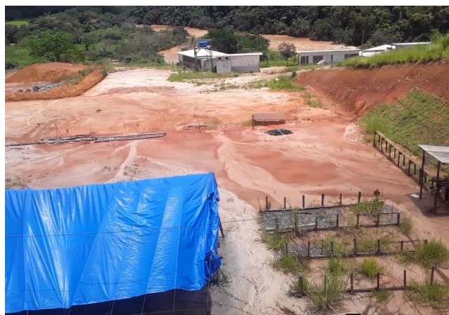
As obras da ETE-Ponte Nova ficam na Fazenda Gravatá, a 06 quilômetros da Rasa