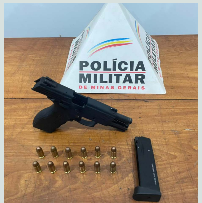
Policiais militares apreenderam a arma e munições em Jequeri

O motorista, homem de 56 anos, apresentou o registro da arma e afirmou ter autorização para a prática de tiro esportivo e caça com a arma. Na verdade, ele se enquadra no CAC (Colecionador, Atirador Desportivo e Caçador), mas não possuía a devida autorização (guia de trânsito) para transportar a arma. Delegacia de Polícia com a arma e munições apreendidas para que fossem adotadas as demais providências legais.