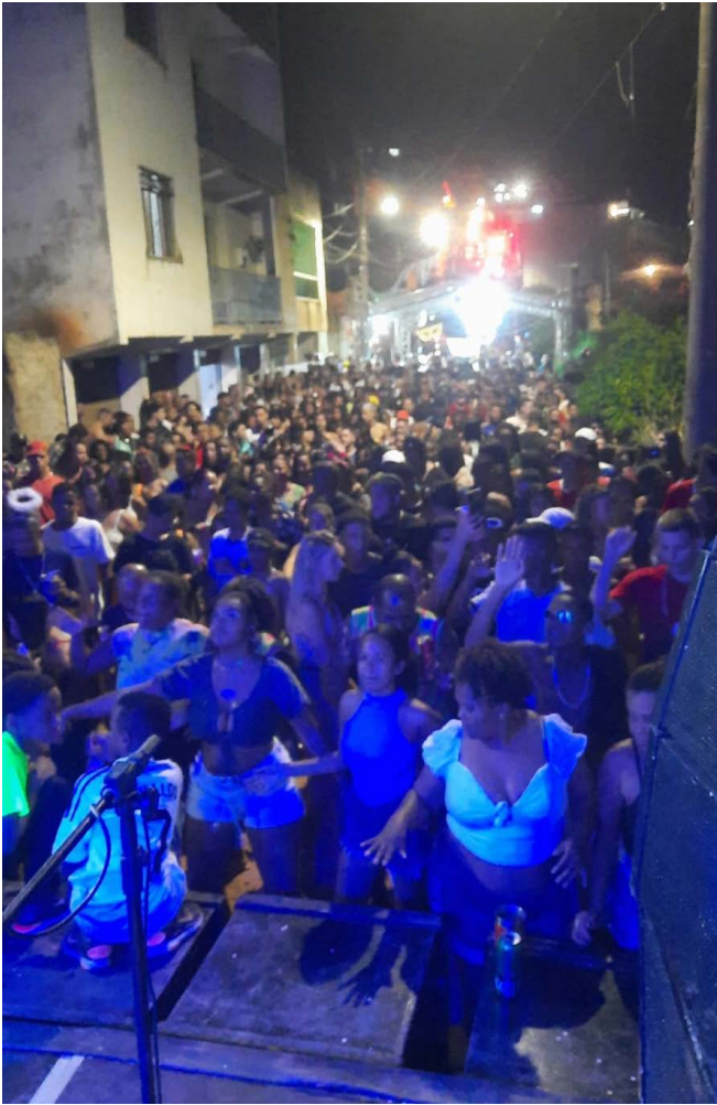
Multidão prestigiou a festa no Triângulo ao som de bandas e animação do "Bloco é por isso que sai fuxico com seu nome".