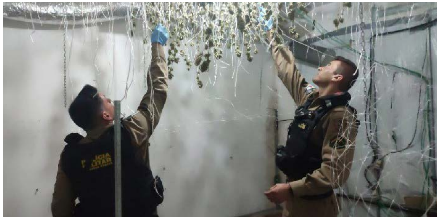
Página 13 Policiais militares de Viçosa prenderam membros da quadrilha que produzia em estufas hidropônicas skunk ou supermaconha

Carros de luxo e laboratórios de skunk, a supermaconha, ou “maconha de rico”. A Polícia Militar (PM) encontrou 06 (seis) imóveis usados para cultivar, estocar e vender drogas em Viçosa e região. Nove (09) suspeitos foram presos, entre eles, 01(um) jovem de 22 anos, de Ponte Nova. A quadrilha do tráfico de drogas tinha base no Vale do Aço.