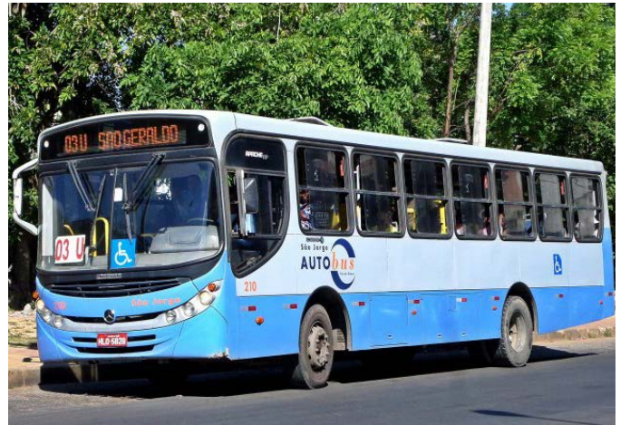
A São Jorge Auto Bus atende todos bairros, distritos e povoados de Ponte Nova, mas a frota é pequena