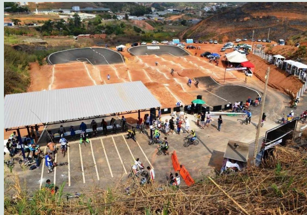
Pistas de BMX (bicross) no Clube do Sol, em Manhuaçu

O BMX surgiu graças à admiração de jovens norte-americanos pelo MotoCross. A vontade de imitar as manobras dos ídolos aliada à falta de equipamento fez com que bicicletas fossem utilizadas em pistas de terra. Nasceu, então, o Bicycle Moto Cross, ou simplesmente BMX.