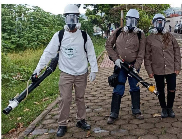
Os profissionais de Saúde trabalharam com Equipamentos de Proteção Individual (EPIs) para aplicar o Fumacê nas ruas dos bairros São Pedro, Fátima, Triângulo Novo, Triângulo e Centro Histórico/Primeiro de Maio

A secretaria municipal de Saúde de Ponte Nova, além de movimentar os Agentes de Endemias para percorrer quintais e áreas públicas (lotes vagos) para promover o “Desentulha de Ponte Nova”, retirando entulhos e lixos que podem acumu-