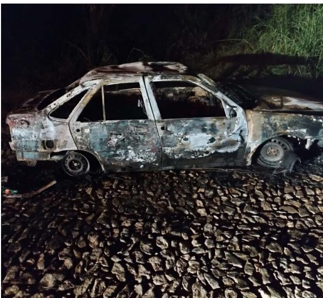
O carro incendiado teve perda total

Na madrugada de 21 de fevereiro, 01 (um) carro foi incendiado na Rodovia MGC-120, na entrada do Bairro Oswaldo Amaral, em Teixeira. O