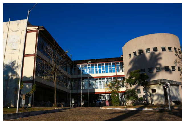
1.300 estudantes estão matriculados nos cursos do Icea de João Monlevade

A UFOP (Universidade Federal de Ouro Preto) publicou o edital para a licitação de 01 (quatro) lanchonetes em seus campi. Em Ouro Preto, a licitação é para as cantinas da Escola de Minas e do Departamento de Engenharia Geológica (Degeo); em Mariana, para o Instituto de Ciências Humanas e Sociais (ICHS) e em João Monlevade para o Instituto de Ciências Exatas e Aplicadas (Icea).