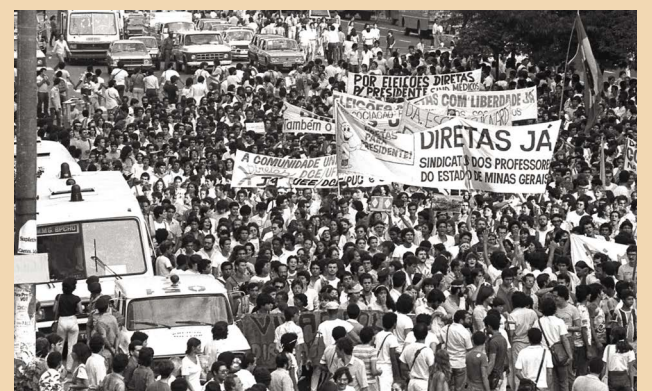
Comício das Diretas Já! reuniu mais de 400 mil pessoas em BH há 39 anos

O evento estava marcado para começar às 17 horas, com a expectativa de levar às ruas cerca de 150 mil pessoas. Por volta das 15 horas ficou claro que o público esperado superaria as expectativas dos organizadores. O registro do público total presente no evento não foi oficializado, mas as estimativas de organizadores e autoridades foram de 400 mil pessoas. (Com informações do jornal Estado de Minas).