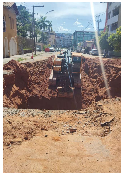
A cratera se rompeu na segunda-feira, 20/02