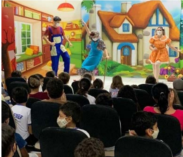
Secretaria de Cultura de São Paulo patrocina peça de teatro que percorre o interior para combater a proliferação da dengue

plo, realizarem concurso literário, exposição de artes visuais, mostra teatral, festival de cinema, programa de rádio, dentre outras iniciativas que tratem dessa temática. As ações podem ocorrer na biblioteca do CEU das Artes Ruy Merheb bem como nas praças dos bairros, nos pontos de ônibus. Além de alcançar a população de diversas maneiras, também é possível abordar diferentes áreas como assistência social, educação ou o que se mostrar necessário na realidade local.