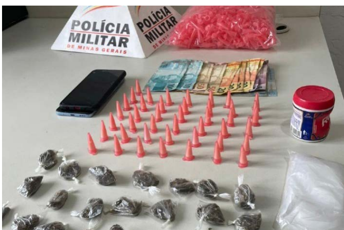
📍 A equipe da PM encontrou grande quantidade de drogas no restaurante, mas não localizaram o filho da mulher.

Em depoimento ele disse que o esquema criminoso pertence a seu filho. No restaurante, os policiais encontraram grande quantidade de drogas, mas não conseguiram encontrar o filho da mulher. A mulher foi presa em flagrante por tráfico e posse de drogas. Na Delegacia de Polícia Civil foi ouvida pelo delegado da área e encaminhada para o presídio de Ervália.