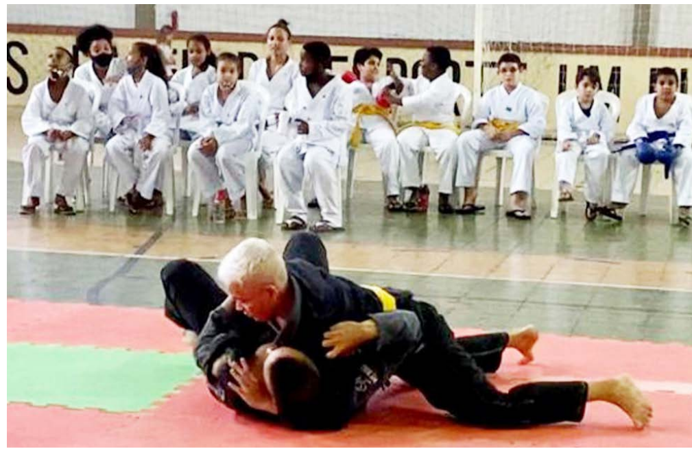
Prática de artes marciais em Ponte Nova ajuda no recebimento de recursos financeiros

Viçosa não recebeu recursos em 2020, 2021 e 2022 devido à não comprovação da realização de atividades esportivas nos anos de 2018, 2019 e 2020. De acordo com a legislação estadual, as atividades realizadas em um ano são comprovadas somente no ano seguinte, quando também são divulgadas as pontuações para as transferências de recursos no ano subsequente.