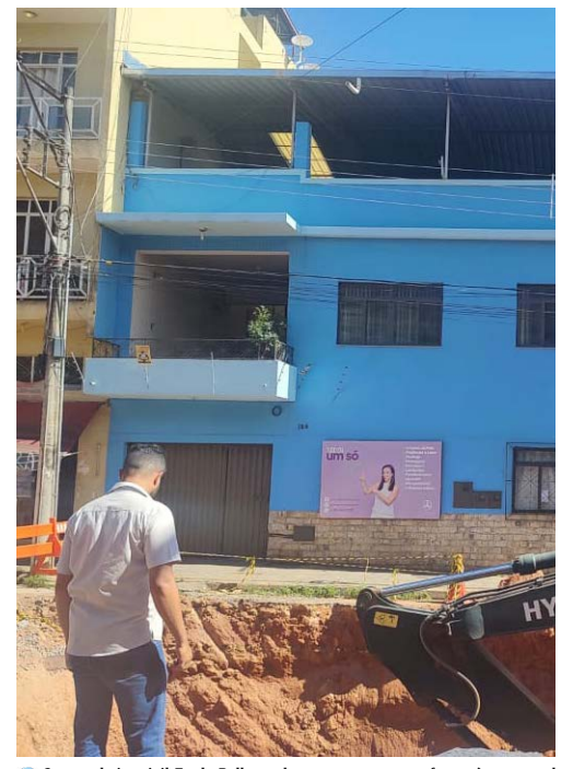
O engenheiro civil Fredy Byllyga observa a cratera em frente à casa azul onde estava a cisterna rompida na Avenida Nossa das Graças