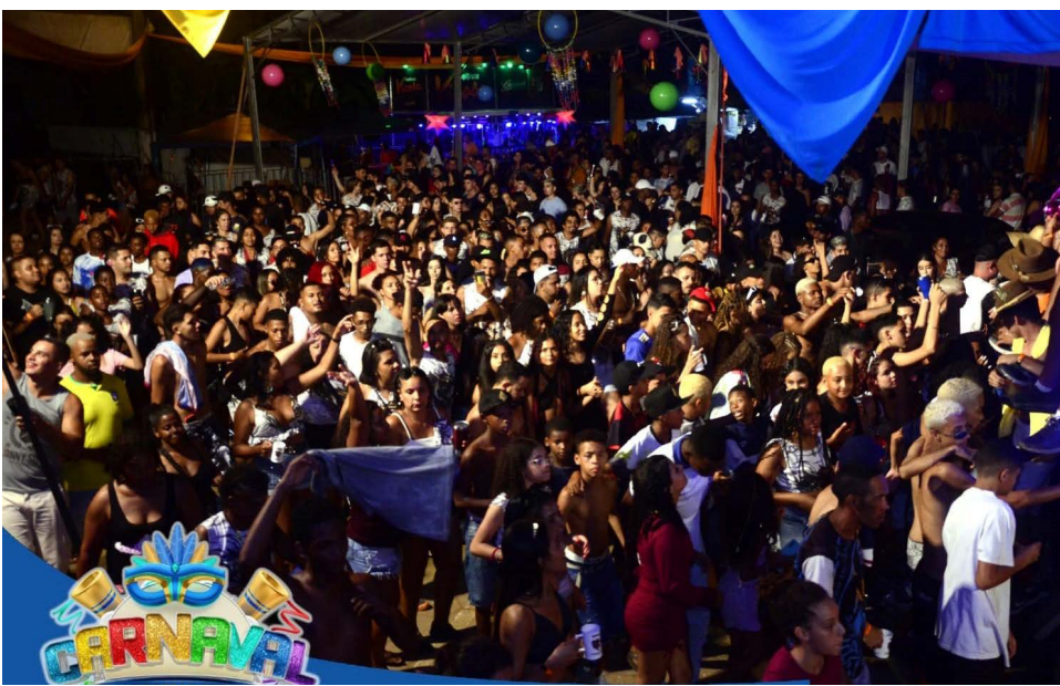
Alegria e muita gente no Bloco Isoporzinho na praça principal do Bairro Triângulo

Na região do Vale do Rio Piranga várias cidades realizaram shows em palcos e desfile de blocos, animando os foliões. O Líder Notícias acompanhou as folias de Rio Doce e Guaraciaba e registrou que Viçosa não teve programação oficial divulgada pela administração municipal.