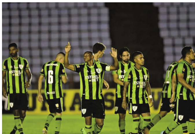
Jogadores do América-MG comemoram classificação

o Coelho venceu todas as partidas como mandante, inclusive, o clássico diante do Cruzeiro, que foi duelado em Brasília. Fora de casa, o América-MG venceu o Pouso Alegre na estreia do Mineiro e obteve ainda 02 (dois) empates, esse contra o Ipatinga e outro com o Athletic, de São João d-el Rei. O Galo também está classificado.