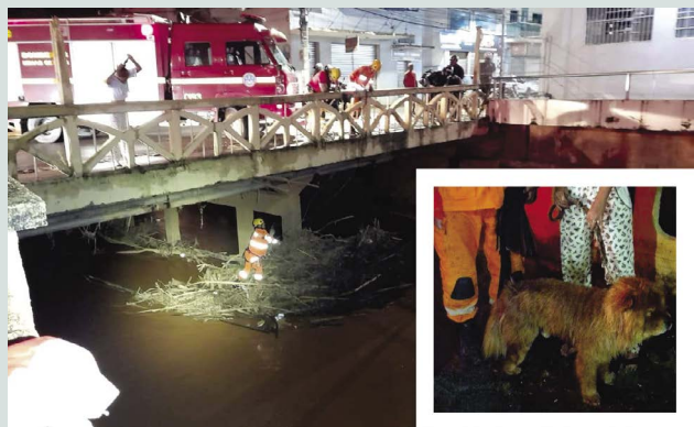
📍 Cão resgatado pelos bombeiros, após operação especial em galhada retirada por pilar da ponte sobre o Ribeirão Vau-Açu

Ao chegar no local, os bombeiros analisaram a situação e utilizaram técnicas de rapel para acessar o animal e realizar sua amarração de resgate. O cão foi içado em segurança a uma altura de aproximadamente 04 (quatro) metros e entregue sem ferimentos para sua tutora.