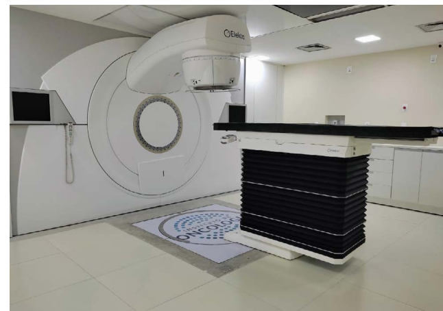
Acelerador linear custou mais de R$ 4 milhões, com emenda parlamentar do PT