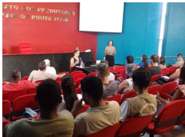
Gestores de saúde da região do Vale do Rio Piranga reuniram por causa da epidemia de dengue

Os problemas apresentados em Ponte Nova e Viçosa não são decorrentes das atuais administrações. As anteriores também não conseguiram solucioná-los, como criação de rotas acessíveis, promovendo a eliminação de degraus e demais obstáculos que prejudicam, principalmente, o tráfego das pessoas com dificuldade de locomoção, bem como com a sinalização para aquelas que apresentam baixa acuidade visual, ou completamente cegas.