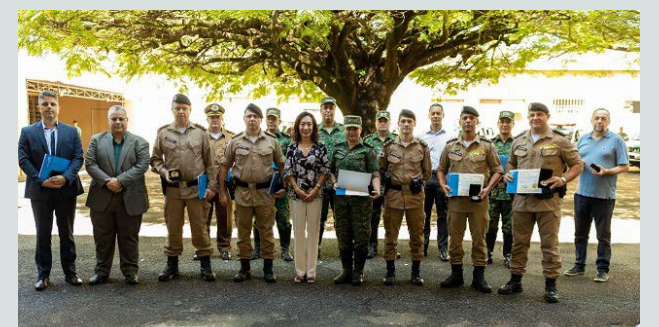
Os novos equipamentos ajudarão no policiamento operacional, além de melhorar a gestão da tropa e dos recursos tecnológicos.

Para a aquisição dos 215 tablets foram investidos R$ 400 mil. O valor é oriundo de Termos de Ajustamento de Conduta (TACs) propostos pelo Governo de Minas e pelo Ministério Público de Minas Gerais e assinados pelas mineradoras que não conseguiram cumprir o prazo estabelecido pela Lei “Mar de Lama Nunca Mais”, para o descomissionamento de barragens a montante da lavra de mineração.