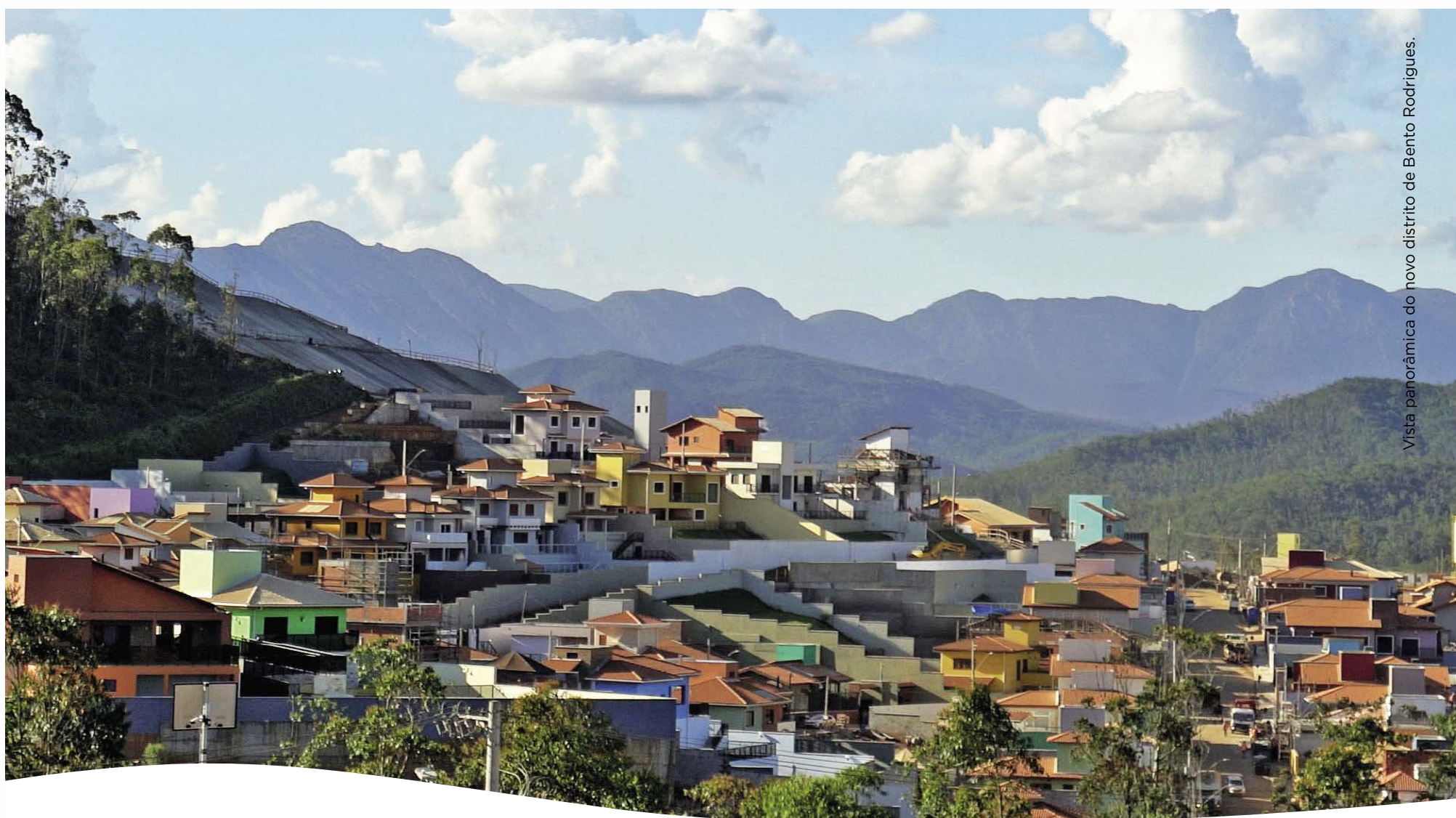
Vista panorâmica do novo distrito de Bento Rodrigues.