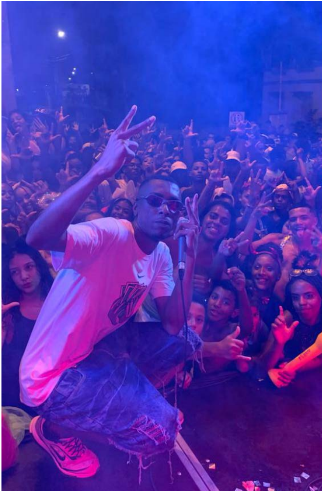
Cê Credita? arrastou uma multidão no Bairro Primeiro de Maio

Cerca de 12 mil pessoas, com destaque maior para a quantidade de pessoas que foram ao Bairro Primeiro de Maio, no sábado de Carnaval (18/02), com atrações durante a tarde e a noite: "Bloco Cê Credita?" Forró de Dois; Raízes do Samba e Trap Ponte Nova. No domingo (19/02), a folia invadiu as ruas do Distrito Vau Açu, com o "Bloco Dona Onça", além das atrações ofertadas pela secretaria municipal de Cultura, Turismo e Comunicação: Forró de Dois e Higão.