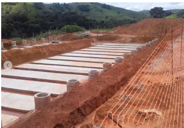
As obras da ETE-Ponte Nova estão abandonadas depois da rescisão de contrato

2018 junto à Supram-Zona da Mata (Superintendência Regional de Meio Ambiente – Zona a Mata), em Ubá. O financiamento das obras de tratamento de esgoto em Ponte Nova é da ordem de R$ 22 milhões, contratado junto à Caixa Econômica Federal. Os recursos são acrescidos de juros, considerados baixos. As parcelas começarão a ser pagas pelo erário de Ponte Nova a partir de 2026.