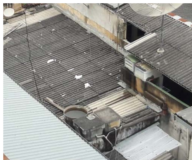
Caixa d'água destampada pelo temporal de 07 de fevereiro continua com criadouro do mosquito Aedes Aegypti em plena Palmeiras (Avenida Dr. Otávio Soares)