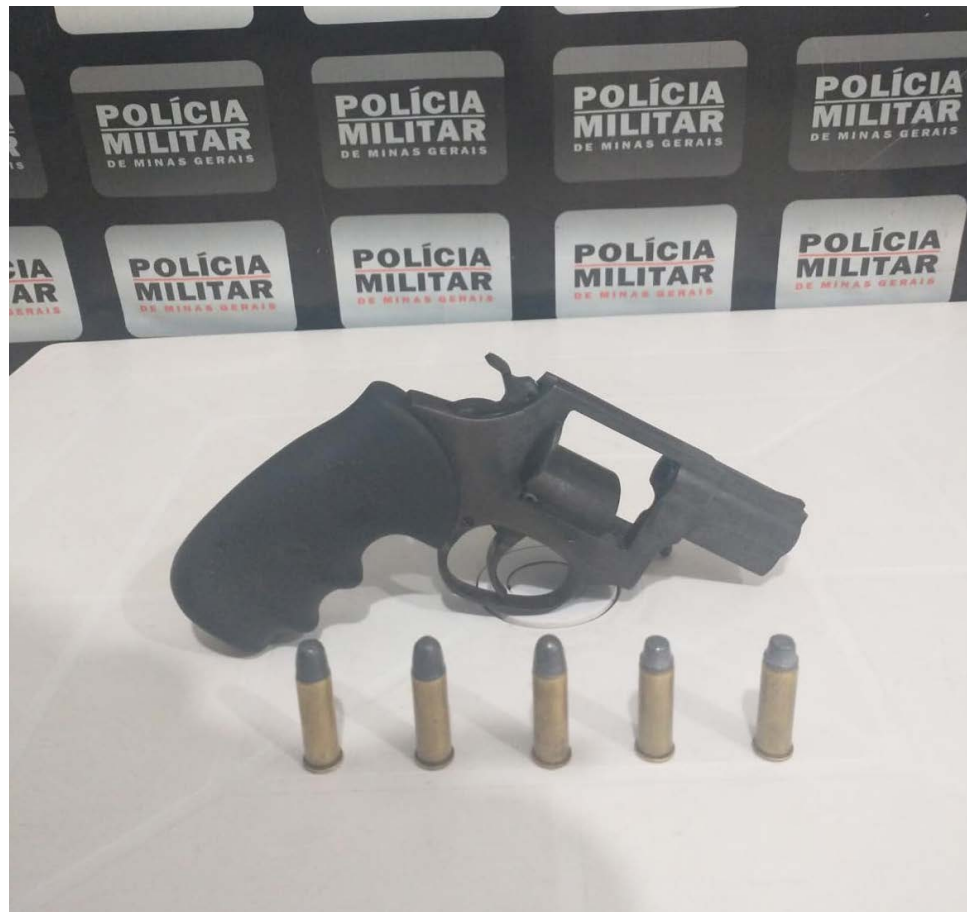
Arma e munições encontradas no veículo parado na blitz em Oratórios

Os militares realizaram buscas no veículo e encontram debaixo do banco do passageiro 01 (um) revólver calibre 38 e 05 (cinco) munições. O passageiro tem 29 anos e assumiu ser o proprietário da arma e das munições. Após o registro da ocorrência, o autor foi preso e conduzido para a Delegacia de Polícia Civil com a arma e munições apreendidas.