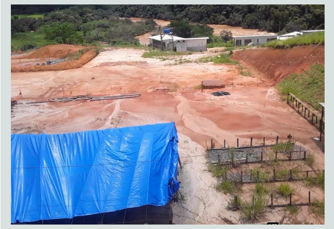
Semam e DMAES buscam a continuidade das obras da ETE-Ponte Nova com a empresa 2ª colocada na licitação de 2020