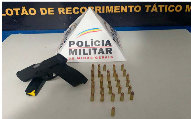
🔍 PM apreendeu arma e munições em 06 de dezembro

Aos 44 minutos (madrugada) de terça-feira, 06 de dezembro, uma guarnição da Polícia Militar realizava patrulhamento quando avistou na Rua Geraldo Xeleco Magela