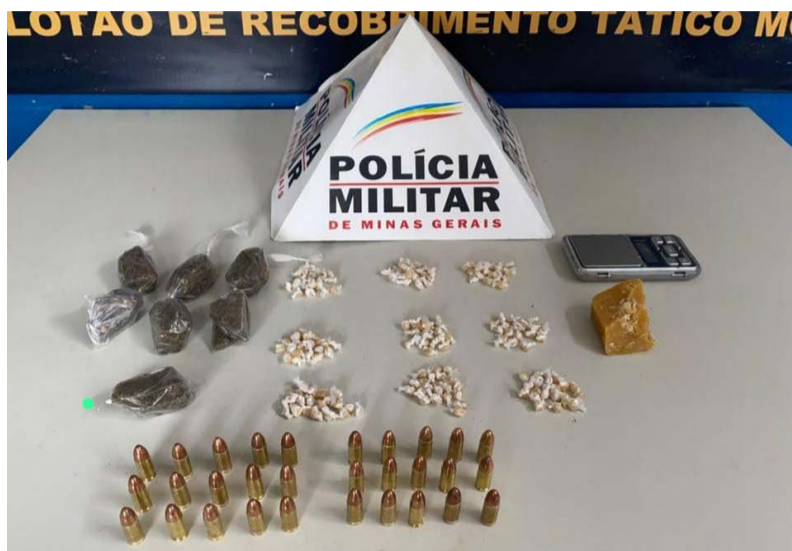
🔍 Drogas e munições apreendidas na Vila Alvarenga por policiais militares

No dia 1º de dezembro, uma guarnição da Polícia Militar de Ponte Nova recebeu informações que indivíduos estavam vendendo entorpecentes numa área de mata existente ao final de uma conhecida via