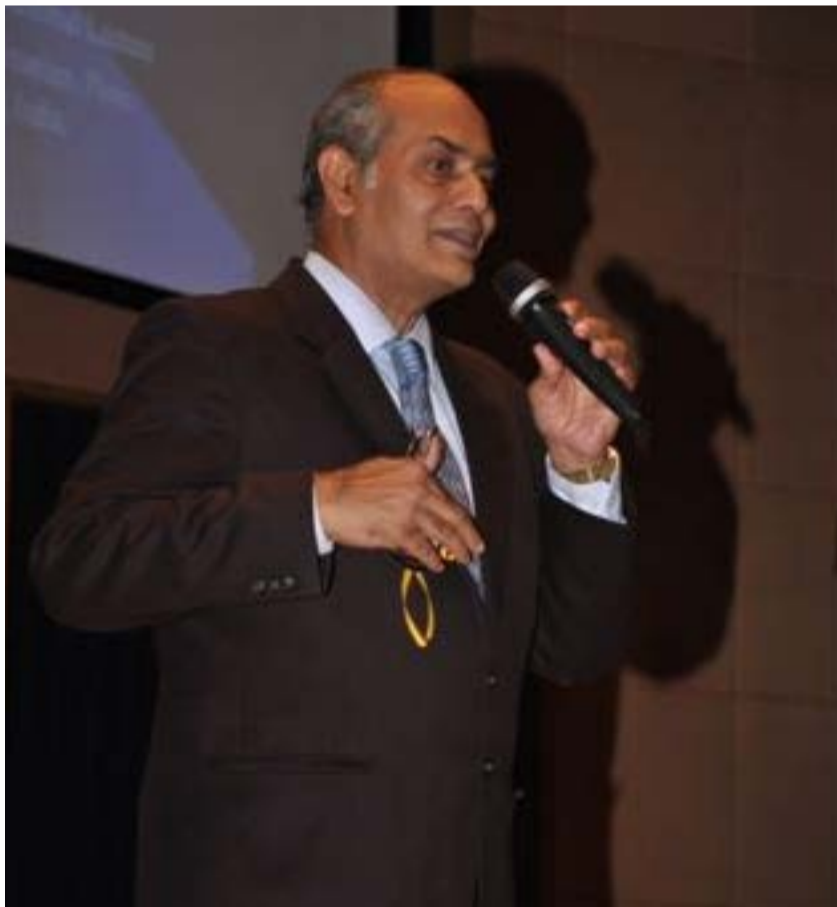
O psiquiatra indiano defende medicina de prevenção para levar à longevidade: não à medicina paliativa