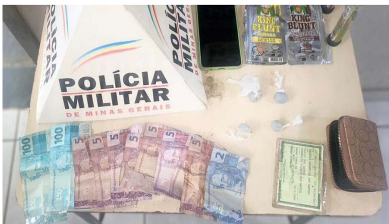
🔍 Maconha, dinheiro e celular foram apreendidos pelos militares

No domingo passado, 04 de dezembro, durante a realização da Operação Natalina, uma guarnição da Polícia Militar de Barra Longa visualizou um veículo deixando área de mata no Córrego do Bananal, zona rural do município. O boletim de ocorrência consta que o fato aconteceu às 17h37min.