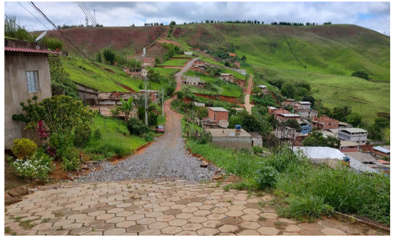
Bairro Nova Copacabana surgiu na década de 1990, mas passados quase 30 anos continua sem infraestrutura adequada, deixando os moradores e as moradias em situação precária

O Bairro Nova Copacabana foi iniciado pela Imobiliária Ouro Verde, empresa de Belo Horizonte, mas dirigida por pessoas com parentes em Ponte Nova, durante a gestão do prefeito Padre Ademir Ragazzi, ainda no 2º ano de sua passagem pela Prefeitura, em 1994. O terreno foi adquirido e sua implantação foi autorizada