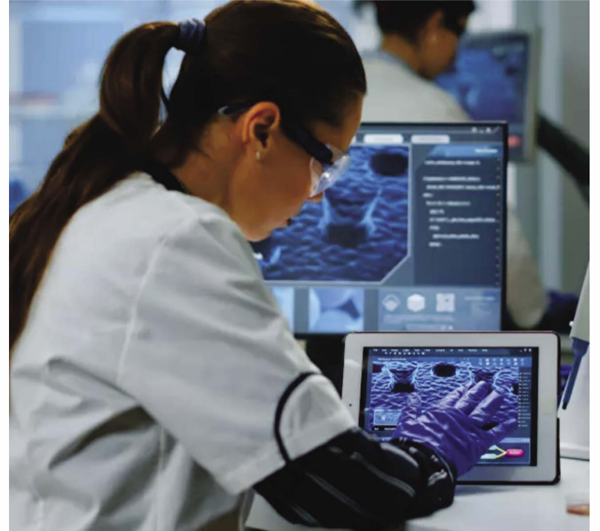
A medicina moderna se trata sempre do que está em pauta no momento. Dos avanços tecnológicos de uma época a ampla utilização deles em atendimentos.

Um olhar de perto para a medicina complementar e alternativa é necessário para encontrar modelos apropriados que esta possa vir a ter, à parte seus grandes discursos ou sua hostilidade para com o cuidado médico tradicional. A medicina é uma manifestação do Eros humano (desejar com muito amor) e não deve tornar-se instrumento de seu Tanatos (personificação da morte na mitologia grega).