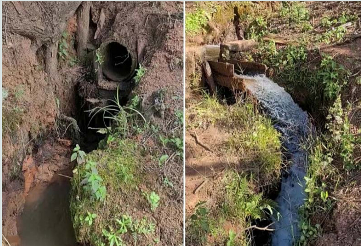
Depois das ações da ZMM a água parou de correr no leito do córrego Vista Alegre, em Teixeira