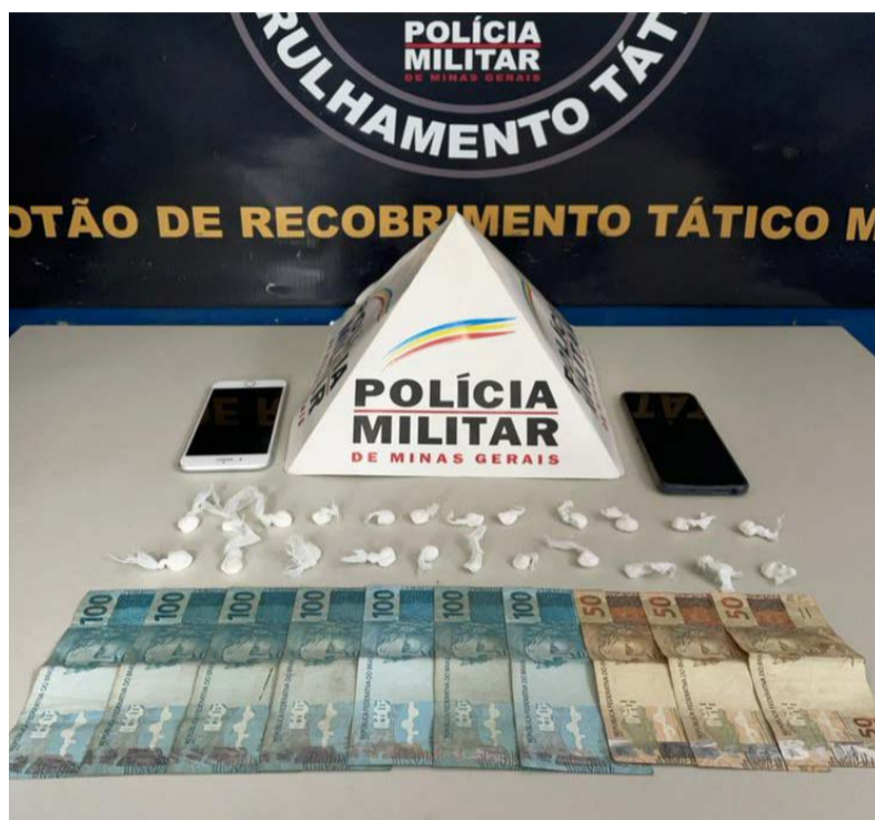
📍 Droga, dinheiro e celulares encontrados com a adolescente seu namorado e apreendidos pela PM

Durante as buscas, os policiais encontram numa pochete a quantia de R$ 850,00 e 02 (dois) aparelhos celulares. Posteriormente, os militares se dirigiram para a casa do infra-