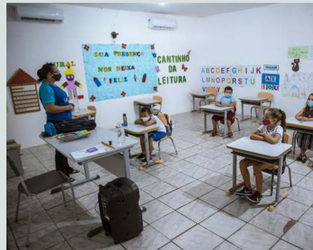
A nova rotina de alunos e professores em salas de aula: uso obrigatório de máscaras (foto ilustrativa)