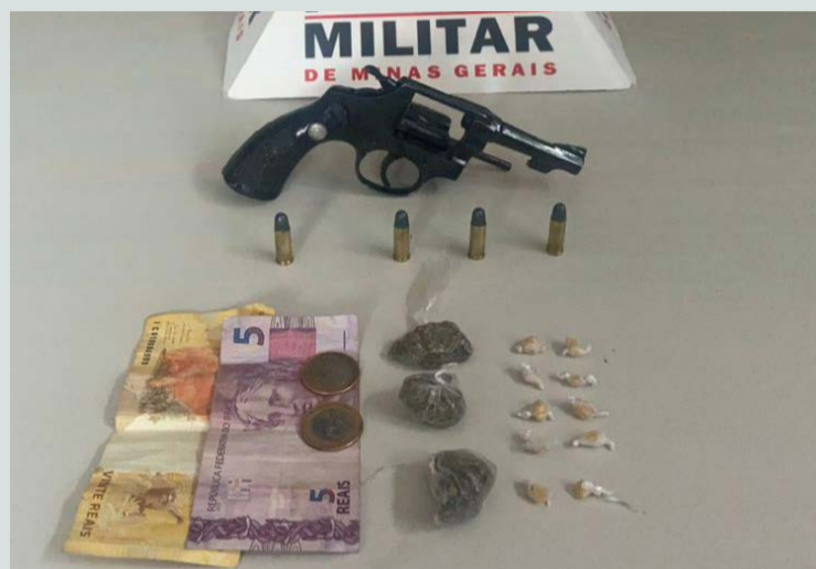
🔍 O material encontrado com o menor e a arma de fogo está sob a guarda da Polícia Civil

Uma guarnição da Polícia Militar realizada patrulhamento ostensivo no Bairro São Pedro, por volta das 16 horas de segunda-feira, dia 05 de dezembro, quando visualizou um adolescente de 16 anos na esquina da Rua José Tanico Rodrigues de Souza. Ele tentou escapar correndo para a Rua Gustavo Julião onde foi detido.