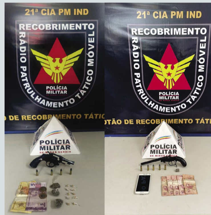
📍 Armas, dinheiro e drogas apreendidos pela PM nos dias 30 de novembro e 1º de dezembro. As ocorrências foram efetuadas nos bairros de Fátima e São Pedro

Adolescentes são apreendidos com drogas e arma de fogo com intervalo de 30 horas