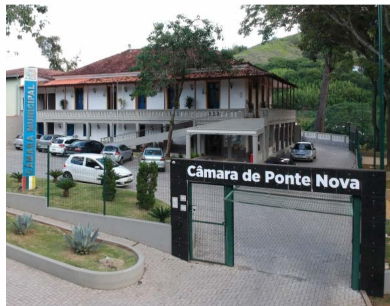
A Câmara Municipal completa 160 anos em 26 de abril de 2023

Além das 10 escolas, 15 alunos também serão premiados. A classificação preliminar dos estudantes participantes em cada uma das 05 (cinco) categorias está disponível no site da Câmara nas categorias Educação Infantil; Ensino