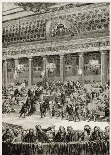
No dia 04 de agosto de 1789, os parlamentares da Assembleia Constituinte aboliram os privilégios oriundos do antigo regime da França e criaram a Declaração dos Direitos do Homem e do Cidadão

A Declaração Universal dos Direitos da ONU surgiu em 1950, exatamente 159 anos depois. Em seu artigo 1º mostra exatamente a que veio: Todos os seres humanos nascem livres e iguais em dignidade e direitos. São dotados de razão e consciência e devem agir em relação uns aos outros com espírito de fraternidade.