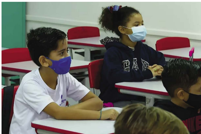
Uso de máscara em escolas de Ponte Nova volta a ser exigido em Ponte Nova (Foto ilustrativa)

A maioria das pessoas que adoecem em decorrência da COVID-19 apresenta sintomas leves a moderados e se recupera sem tratamento especial. No entanto, algumas desenvolvem um quadro grave e precisam de atendimento médico. A infecção pode ocorrer caso você inale o vírus quando estiver perto de alguém que tenha COVID-19 ou se você tocar em