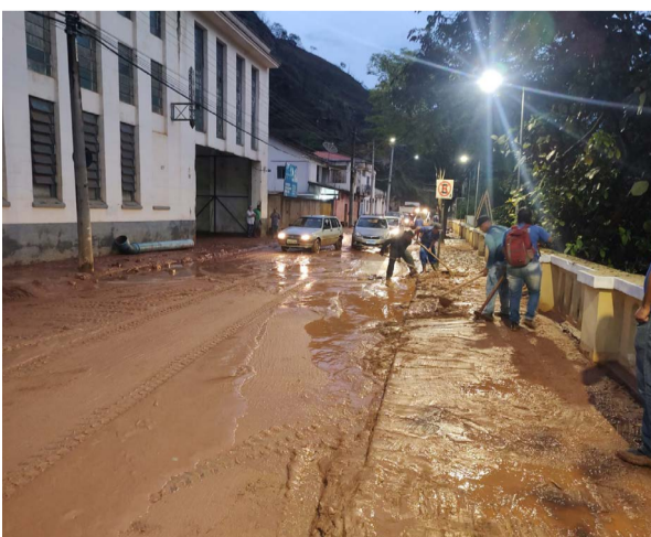
Em 09 de novembro, o maior problema aconteceu no Centro Histórico (Rua João Pinheiro) e na entrada do Bairro Copacabana