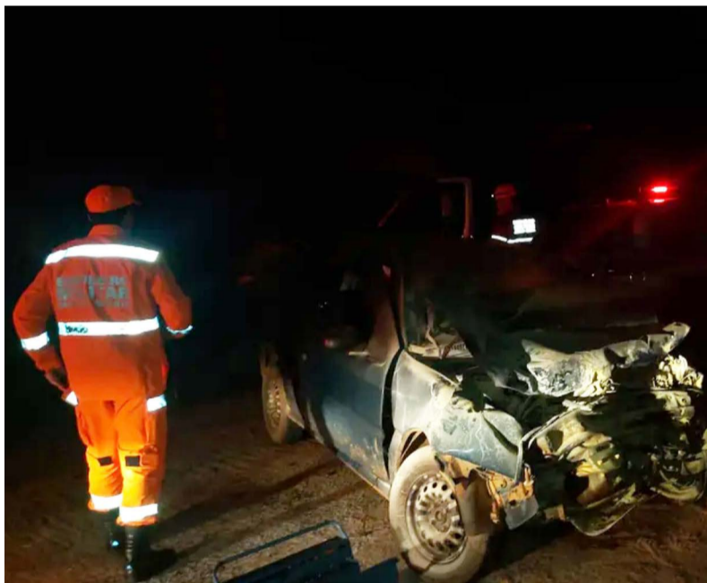
🔍 Vítimas viajavam no veículo que bateu na Van

Elas foram encontradas já sem vida pelos militares. Ainda conforme a corporação militar, ninguém que estava na van teve ferimentos graves. O veículo transportava estudantes, mas não foi informado quantos. A Polícia Militar Rodoviária esteve no local para demais providências e organização do trânsito. Não foi informada a dinâmica da batida e nem as causas, que estavam sendo investigadas pela perícia da Polícia Civil.