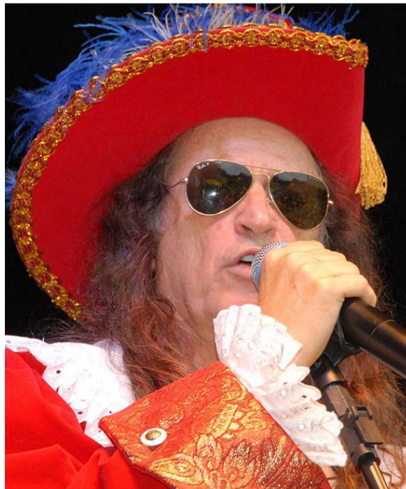
Estilo nordestino de Alceu Valença alcançou o mundo

nossa TARDEZINHA VEM VERÃO, em 11/12, uma área coberta por tenda, com cadeiras para GESTANTES, IDOSOS e PESSOAS COM DEFICIÊNCIA. São 100 vagas e serão preenchidas por ordem de cadastro. O objetivo é garantir conforto, segurança e claro, incluir todos nesse momento de festa. Acesse o link https://forms.gle/QMo65oZP6HSAhJ5Q7 . Em caso de dúvidas, entre em contato conosco na secretaria municipal de Cultura, Turismo e Comunicação pelo telefone (31) 3817 3440", diz nota divulgada nas redes sociais.