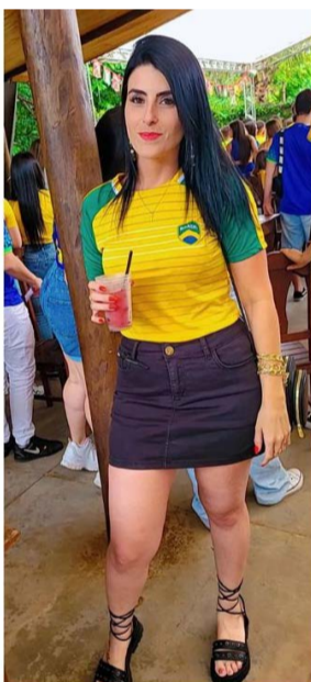
@deborateixeira - Brasil!