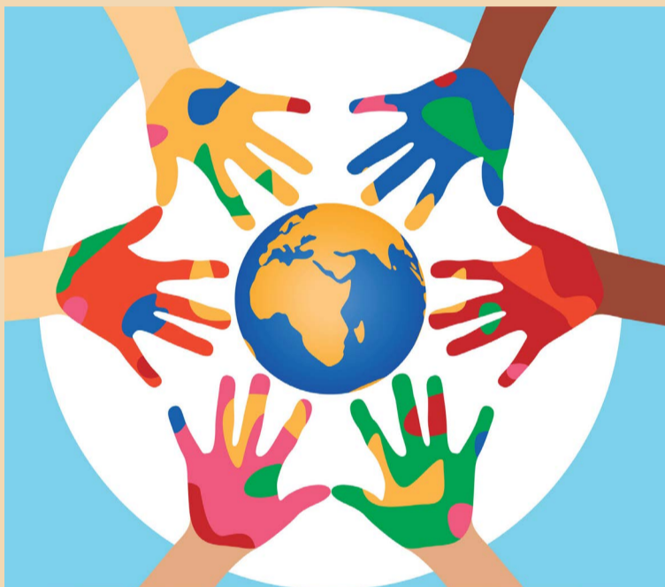
A Declaração Universal dos Direitos Humanos foi criada em 10 de dezembro de 1948

A Declaração Universal principia reconhecendo que "a dignidade é inerente à pessoa humana e é o fundamento da liberdade, da justiça e da paz no mundo". Além disso, declara que os Direitos Humanos são universais independentemente de cor, raça, credo, orientação política, sexual ou religiosa. Ela também inclui os direitos econômicos, sociais e culturais, como o direito à segurança social, saúde e educação.