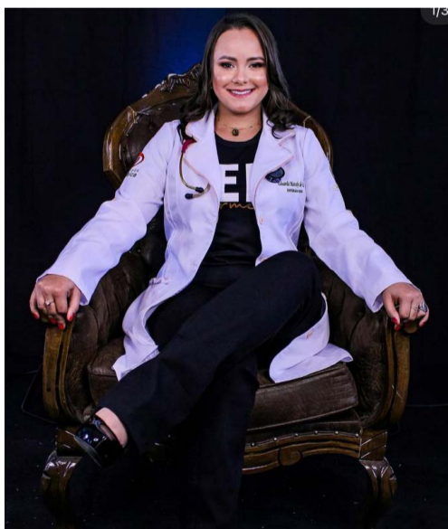
@dudapena - O sonho já é quase realidade!