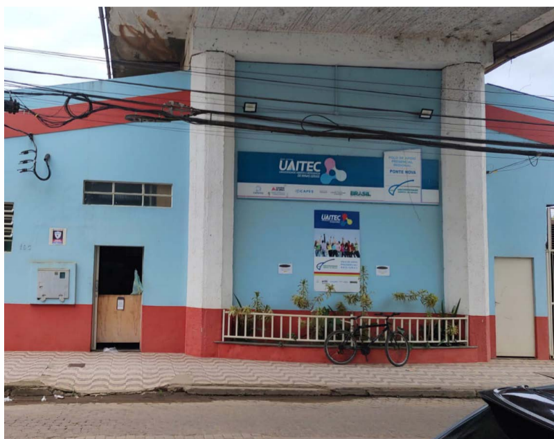
Local onde funcionará o Polo Universitário: Centro Vocacional Tecnológico (CVT)

ção parceira a Universidade Federal de Juiz de Fora (UFJF). O Executivo defende que os cursos serão de grande importância para a especialização da população ponte-novense, para promover a educação local e regional, fomentando também o desenvolvimento econômico, pois a previsão é o oferecimento de cursos voltados às áreas de laticínios, suinocultura e frigoríficos e outros pertinentes à realidade local.