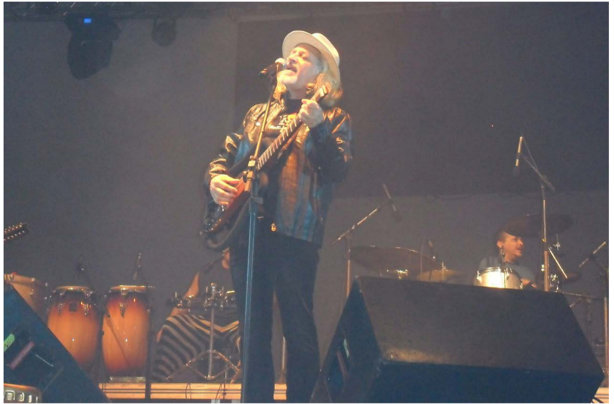
Alceu Valença vai agitar o fim de semana de Ponte Nova

Alceu Paiva Valença é um cantor, compositor, instrumentista e advogado brasileiro. Seu disco de estreia foi gravado em parceria com Geraldo Azevedo. Nasceu no interior de Pernambuco, nos limites do agreste com o sertão: São Bento do Una, em 1º de julho de 1946. Seu disco de estreia foi gravado em parceria com Geraldo Azevedo. Influenciado pelos maracatus e repentes de viola Alceu conseguiu utilizar a guitarra com baixo elétrico e, mais tarde, com o sintetizador eletrônico nas suas músicas.