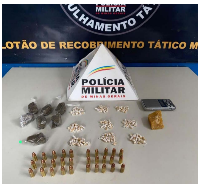
Droga apreendida na Vila Alvarenga onde um homem envolvido foi preso

A PM de Ponte Nova recebeu informações que indivíduos embalavam entorpecentes para a venda numa área de mata existente no final do Bairro Vila Alvarenga. Os indivíduos fugiram ao perceber a presença policial, mas muita droga foi apreendida. Um dos que fugiram voltou ao local do crime e foi preso.