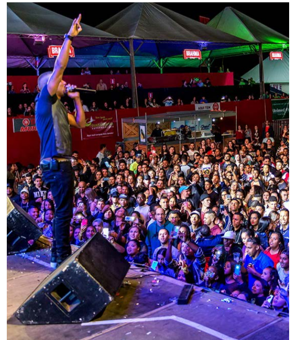
O Parque de Exposições tem capacidade para mais 10 mil pessoas em dias/noites de show