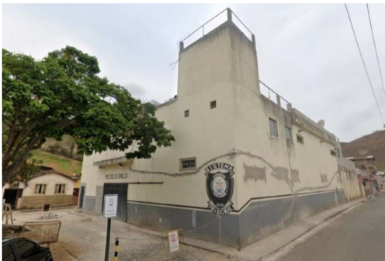
📍 Unidade prisional da cidade de Ervália possui ala feminina

Desde o início de novembro, as mulheres presas em Viçosa oriundas das cidades da microrregião, são encaminhadas para o Presídio de Ervália.