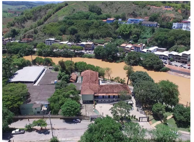
Câmara de Ponte Nova e Colégio Municipal serão abastecidos por energia solar

Parceria entre os poderes Executivo e Legislativo permitirá a implantação de sistema de captação de energia que atenderá os prédios da Escola José Maria da Fonseca (Colégio Municipal) e da Câmara Municipal. O processo licitatório foi realizado em 31 de agosto deste ano para contratação de serviços de engenharia para elaboração de projeto executivo, implantação de sistema de geração