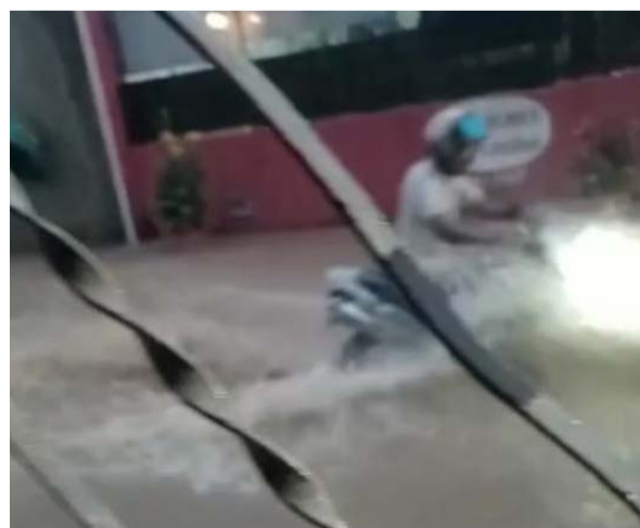
07 de dezembro, Rua Maria Pacheco, no Bairro Sagrado Coração de Jesus/Pinheiro, ficou alagada por falta de drenagem pluvial