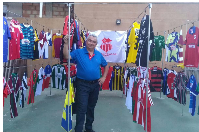
O criador e mantenedor do AHFAM de Minas Gerais já teve passagem pelo rádio e jornal de Ponte Nova

As primeiras tratativas para a exposição em Ponte Nova