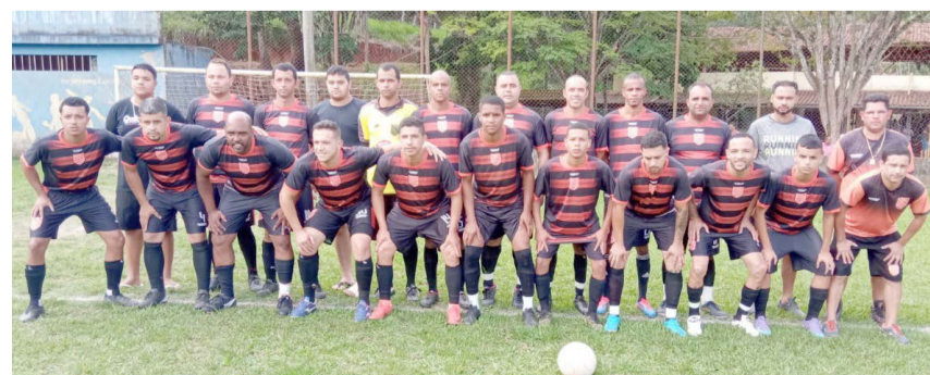
Equipe da Barrinha FC sagrou-se campeã do torneio